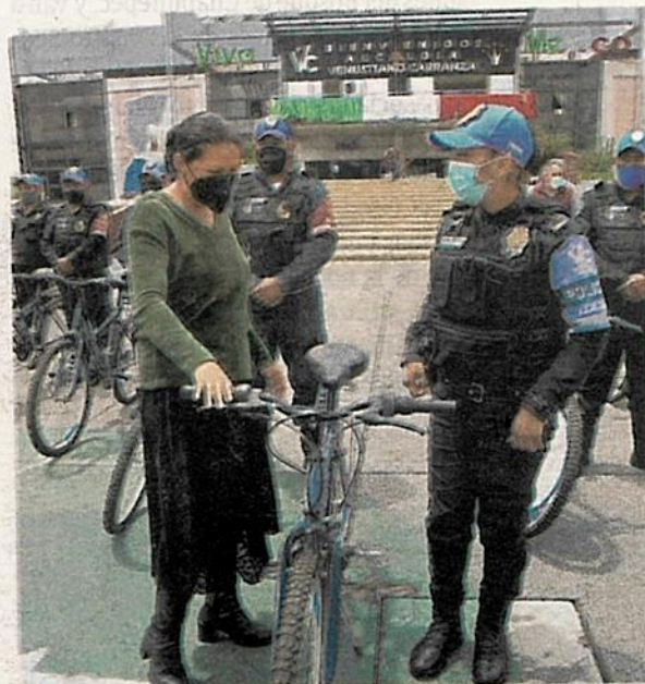
Alcaldesa entrega bicicletas a integrantes de la policía en la Venustiano Carranza.

Con nuestras reuniones del Gabinete de Seguridad