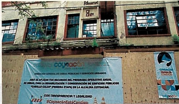
La alcaldía Coyoacán dio inicio a los trabajos de remodelación y edificación de las oficinas administrativas ubicadas en Caballo Calco 22.