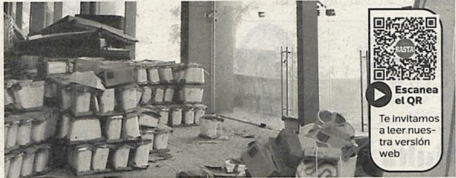
La alberca Francisco Márquez permanece totalmente en el olvido

Por ejemplo, entre 2015 y 2019, la alcaldía invirtió poco más de $156 millones de pesos en dicho espacio deportivo, sin embargo,