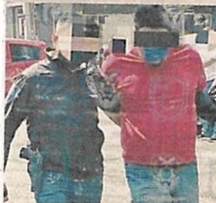
ROSTRO CUBIERTO POR LA AUTORIDAD