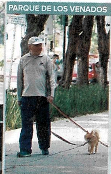
PARQUE DE LOS VENADOS