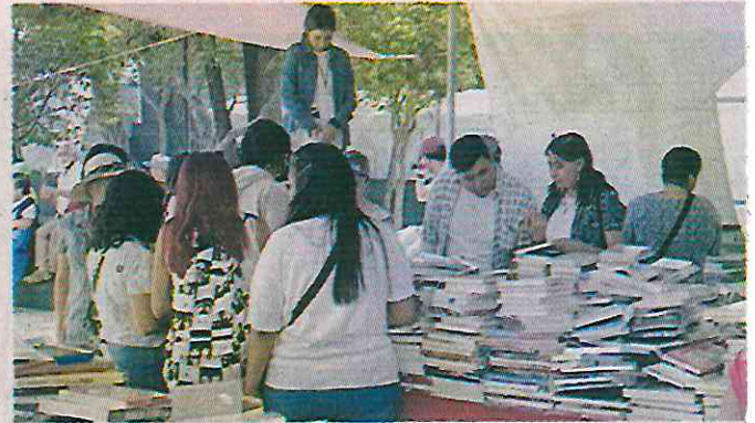
■ Según las autoridades, en las dos ediciones del Gran Remate de Libros de 2023 se vendieron más de 550 mil ejemplares.