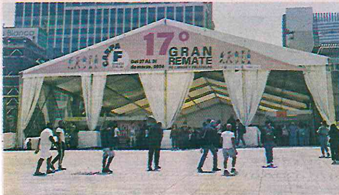
■ En el evento, que está disponible de las 11:00 a 20:00 horas, se ofrecen artículos que van de los 10 hasta los 150 pesos.

El monumento, donde personas tomaban baños de sol sobre la fuente bailarina, que en medio de la sequía y reducción histórica de suministro estuvo apagada, sólo fue una de las paradas que prevé hacer en esta Semana Santa.