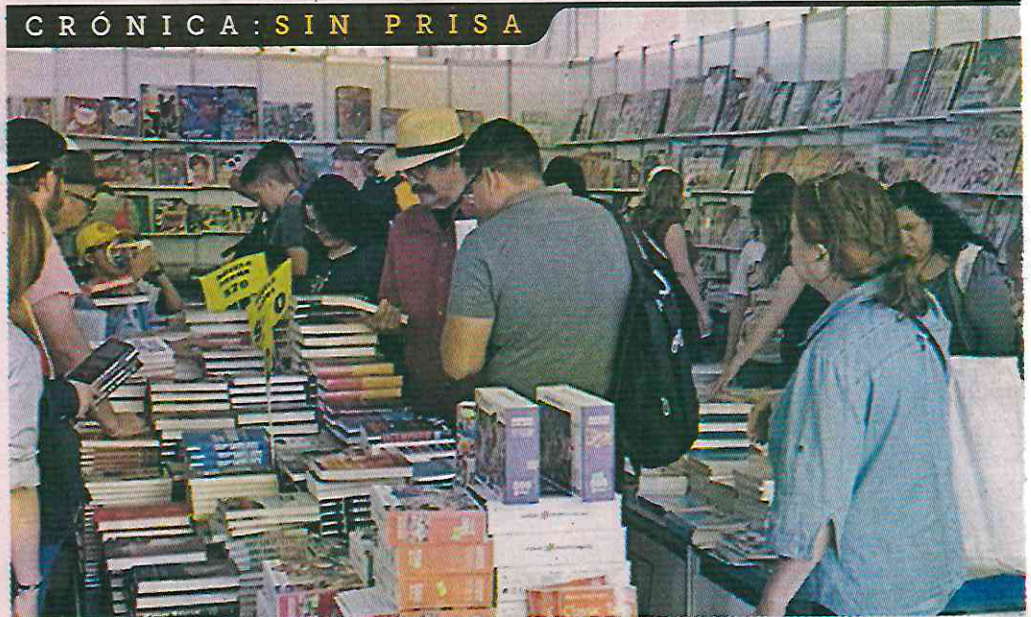
Capitalinos aprovecharon de la poca afluencia en las calles para acudir al 17 Gran Remate de Libros y Películas en el Monumento a la Revolución, el cual estará hasta el domingo.