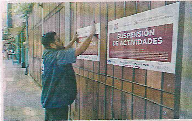
De acuerdo con la PAOT, el establecimiento en Querétaro 217 estará suspendido hasta que se adecuen las medidas.