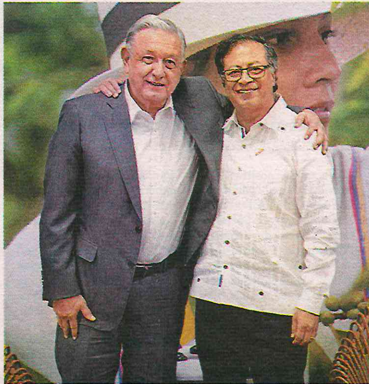
Los mandatarios López Obrador y Petro.

En redes sociales, el mandatario López Obrador añadió que Milei “se atrevió a acusar a su paisano Francisco de ser ‘comunista’ y ‘representante del maligno en la tierra’, cuando se trata del papa más cristiano y defensor de los pobres que yo haya conocido o tenido noticia.