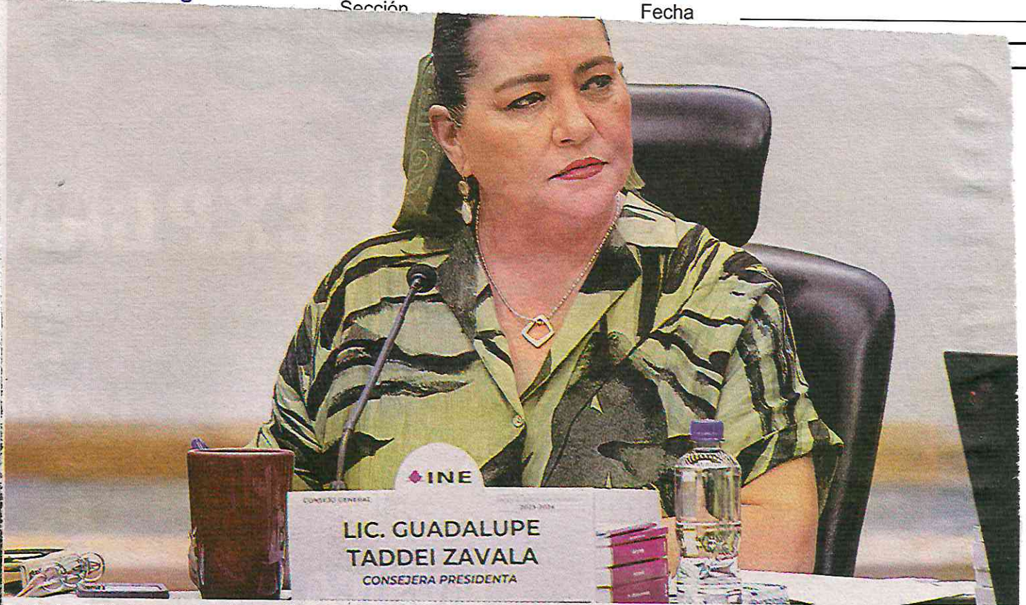
La titular del órgano electoral en sesión extraordinaria.