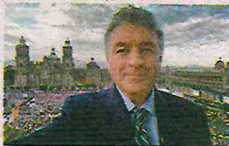
Conductor de televisión

el representante del PT, Gerardo Fernández Noroña, por ser, dijo, "de derecha".