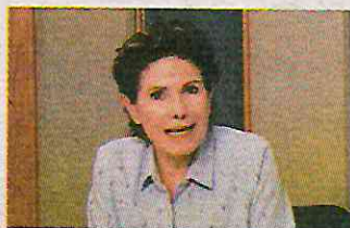
Conductora de televisión