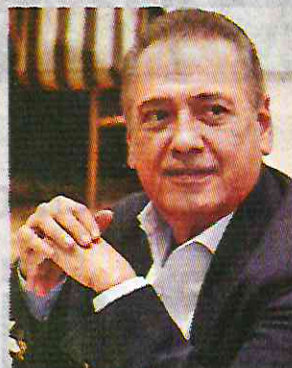
MANLIO F. BELTRONES FCM

Para las próximas elecciones, exgobernadores quieren ocupar un lugar en el Senado de la República; algunos ya habían sido legisladores también.