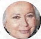
Olga Sánchez Cordero