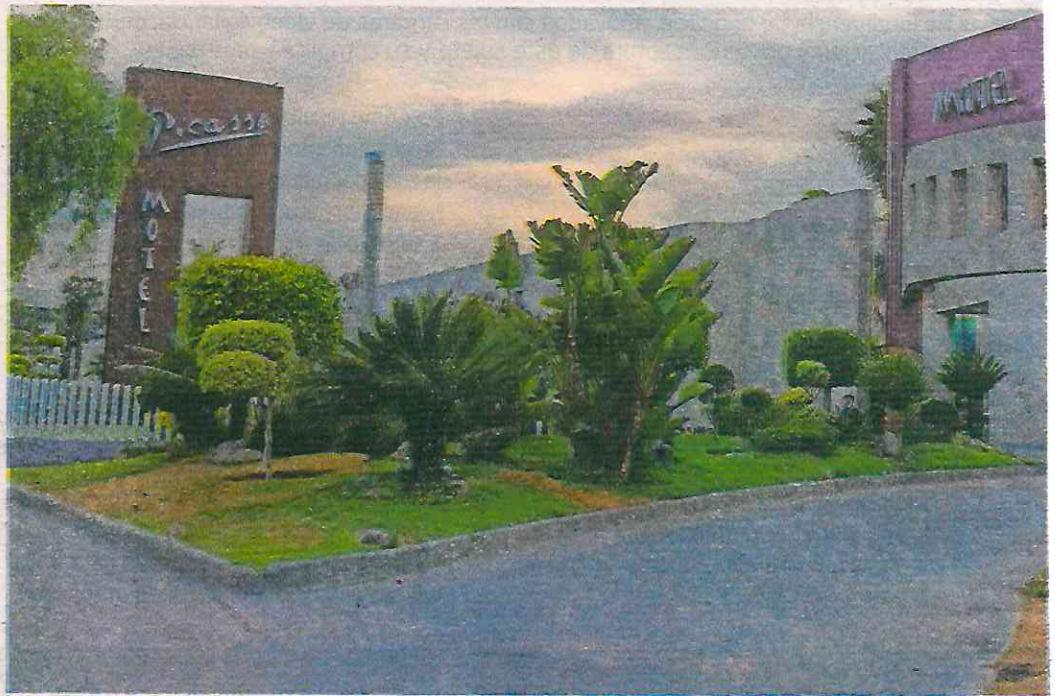
Tras las acusaciones contra las goteras, varias víctimas han expuesto su modus operandi y los lugares a los que acuden

bajaba como conductora en el programa "Que Ritmazo", por lo que la empresa escribió un comunicado en sus redes socia-