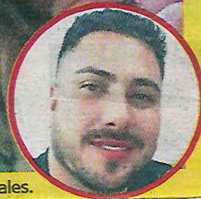
Así aparecen en sus redes sociales.