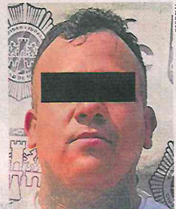
A los detenidos se les liga con cobro de piso, extorsión y narcomenudeo.

Los hechos sucedieron cuando los policías al realizar recorridos de seguridad en el cruce del callejón Canal y la calle Cuitláhuac, se percataron que dos hombres manipulaban bolsas de drogas. ●