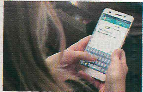
Convocan a activar la verificación en la app

Instó también a la Fiscalía local a desarrollar campañas en medios públicos y digitales para concientizar a los usuarios sobre cómo proteger sus cuentas de WhatsApp, con el propósito de que los usuarios conozcan los protocolos para activar la verificación de la aplicación digital y proteger así su identidad.