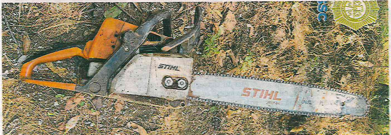
Se le aseguró una camioneta cargada con troncos de manera, una motosierra y un gancho conocido como trocero

Delitos Ambientales y en Materia de Protección Urbana (FEDAPUR) donde continúa bajo investigación y en las próximas horas se determinará su situación jurídica.