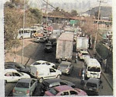
Inseguridad y caos vial

Colonias como Ermita Iztapalapa, la Zona Centro de la