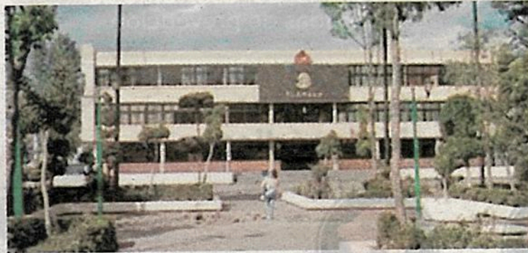
En Tláhuac, la inseguridad va a la alza