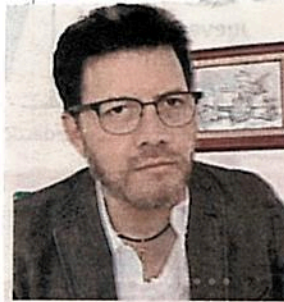
Víctor Hugo Lobo Román , presidente de la Jucopo del Congreso capitalino