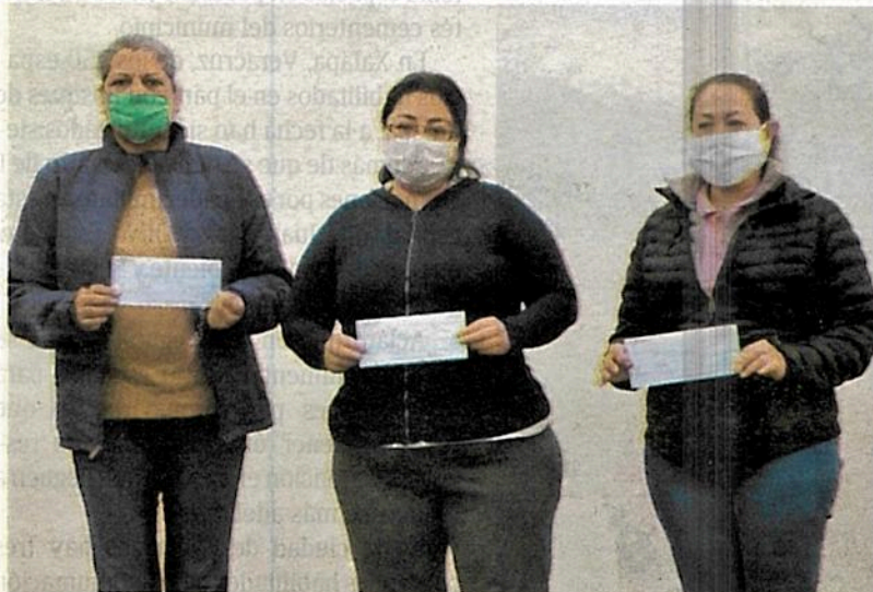
Las 40 familias afectadas recibieron este apoyo único