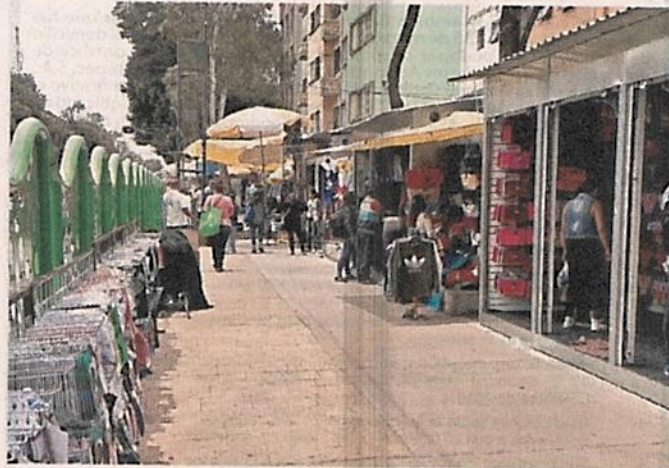
■ Vendedores de Avenida Circunvalación ocupan los locales de lámina y también exhiben mercancía en el barandal.

“Estas intervenciones han carecido de una estra-