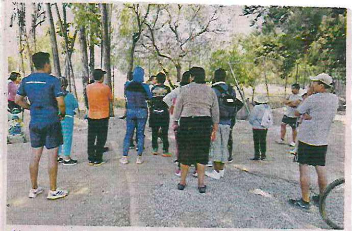
Usuarios del Deportivo Caracoles, en Tlalnepantla, encontraron a la menor muerta cerca de la pista de atletismo.