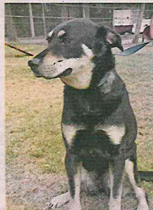
La BVA indicó que esperarán un mes para ser identificados.

fractura expuesta, otro por conjuntivitis derivado de la misma explosión y el último presentaba quemaduras en su pelaje.