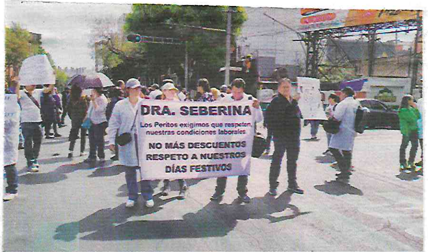
Los peritos han realizado varias manifestaciones para exigir a la Fiscalía mejoras laborales que permitan atender de mejor forma a las víctimas.

En el nuevo sistema de justicia el MP debe presentar pruebas científicas... pero estas no se generaron porque la FGJCDMX "hizo ahorros" presupuestales