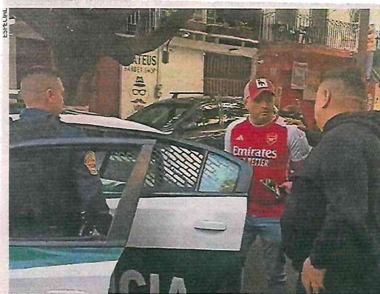
En el lugar de los hechos, policías hallaron al candidato a concejal y a una mujer junto a la víctima.