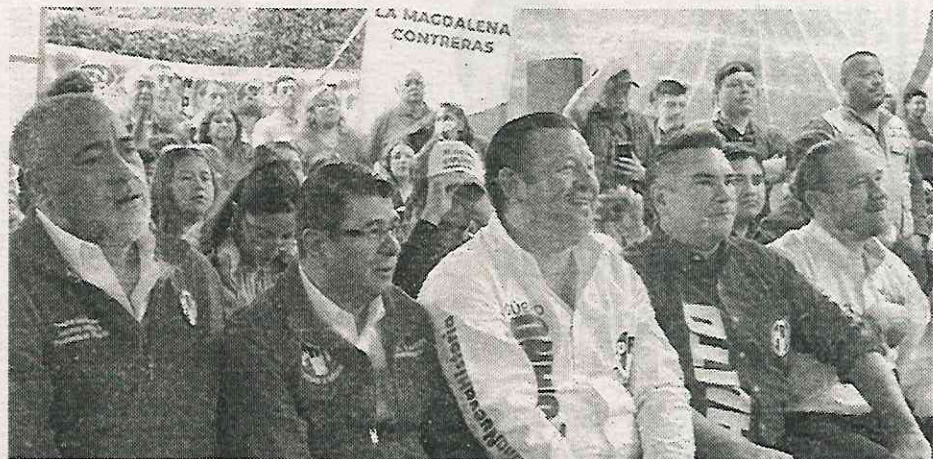
Se considera defensor ambiental, aunque eso está en duda

del último río vivo en la capital del país, durante su administración el priísta fue omiso. Incluso la Dirección General de Ecología y Sustentabilidad de LMC niega tener acciones para ello, mientras que la Dirección General de Administración asegura no tener presupuesto.