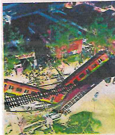
El amparo fue otorgado en favor de siete víctimas de la Línea 12.