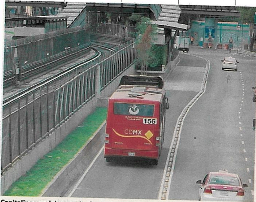
Capitalinos podrán mandar fotos de autos o videos que invadan el carril de Metrobús y se les multará

Quedan exentos los vehículos de emergencia que atiendan una contingencia y que circulen con luces y señales audibles encendidas