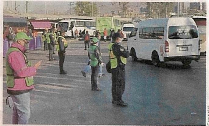
Con la fase preoperativa de la línea 4 del Mexibús dejaron de operar unas 500 peseras y en dos semanas lo harán otras mil.

“El proyecto de Indios Verdes es una reestructuración muy importante del paradero, el objetivo es, precisamente, la mejora de todos los servicios”, acotó.