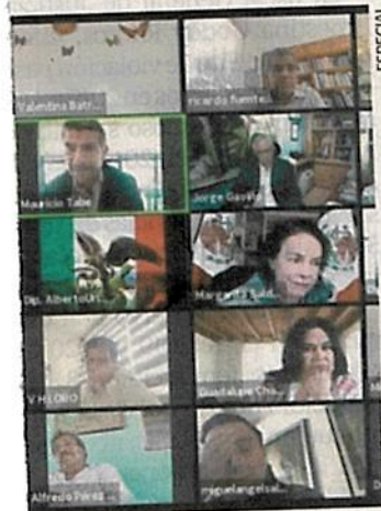
El Congreso fijó el 17 de marzo para recibir a los funcionarios.

Más tarde, la morenista en el siguiente punto pidió exhortar al gobierno federal para que vacune a médicos, enfermeras y demás personal de hospitales, clínicas y farmacias privadas, como el martes pasado lo propuso el panista Christian von Roehrich. ●