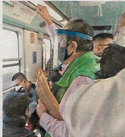
Pese a la mayoría de usuarios del Metro portan cubrebocas, hay quienes evaden la vigilancia al pasar por los torniquetes

"Tengo miedo de contagiarme, de ver a la gente que es tan irresponsable que no respetan a los demás", dijo de entrada en