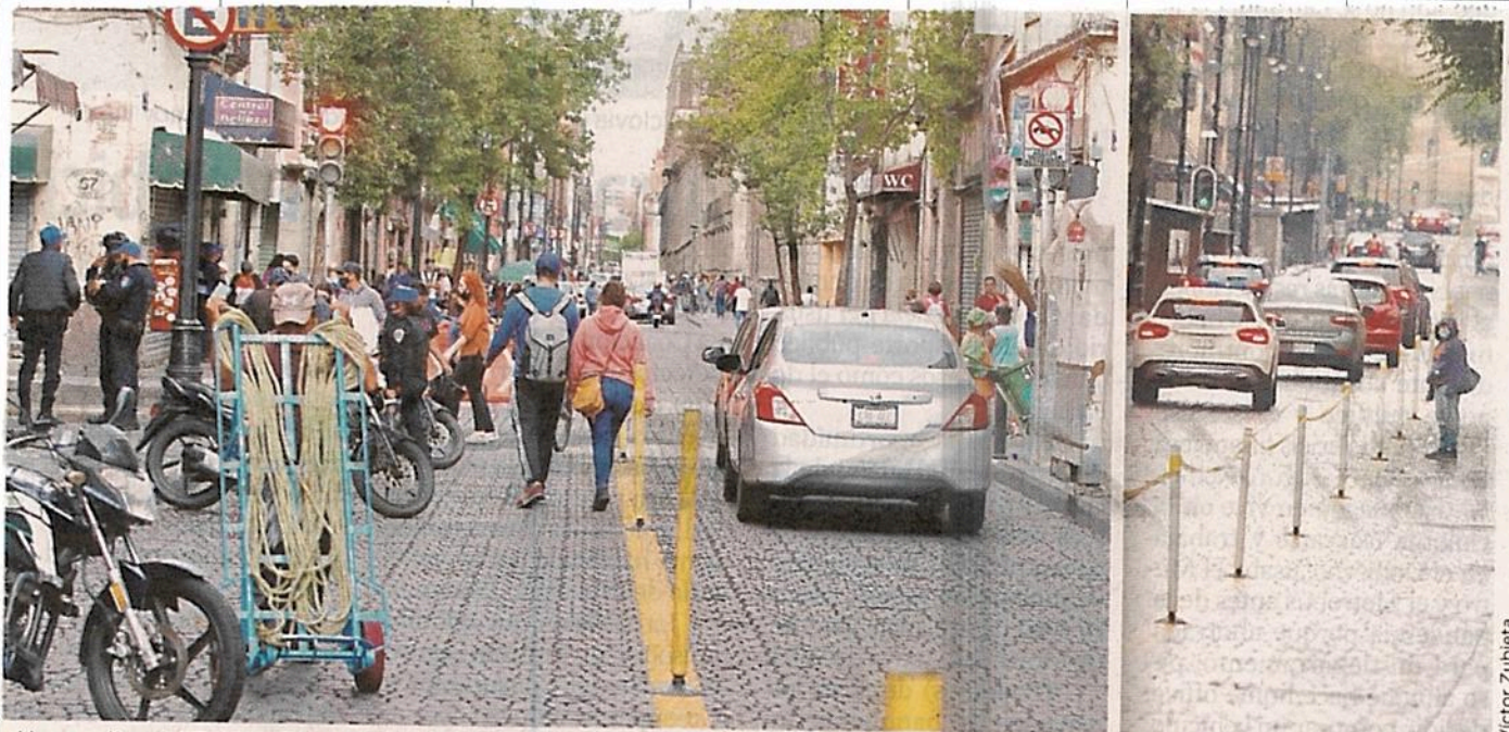
Unas calles del Primer Cuadro fueron divididas por una línea amarilla y bolardos para ceder la mitad del espacio vial al peatón.