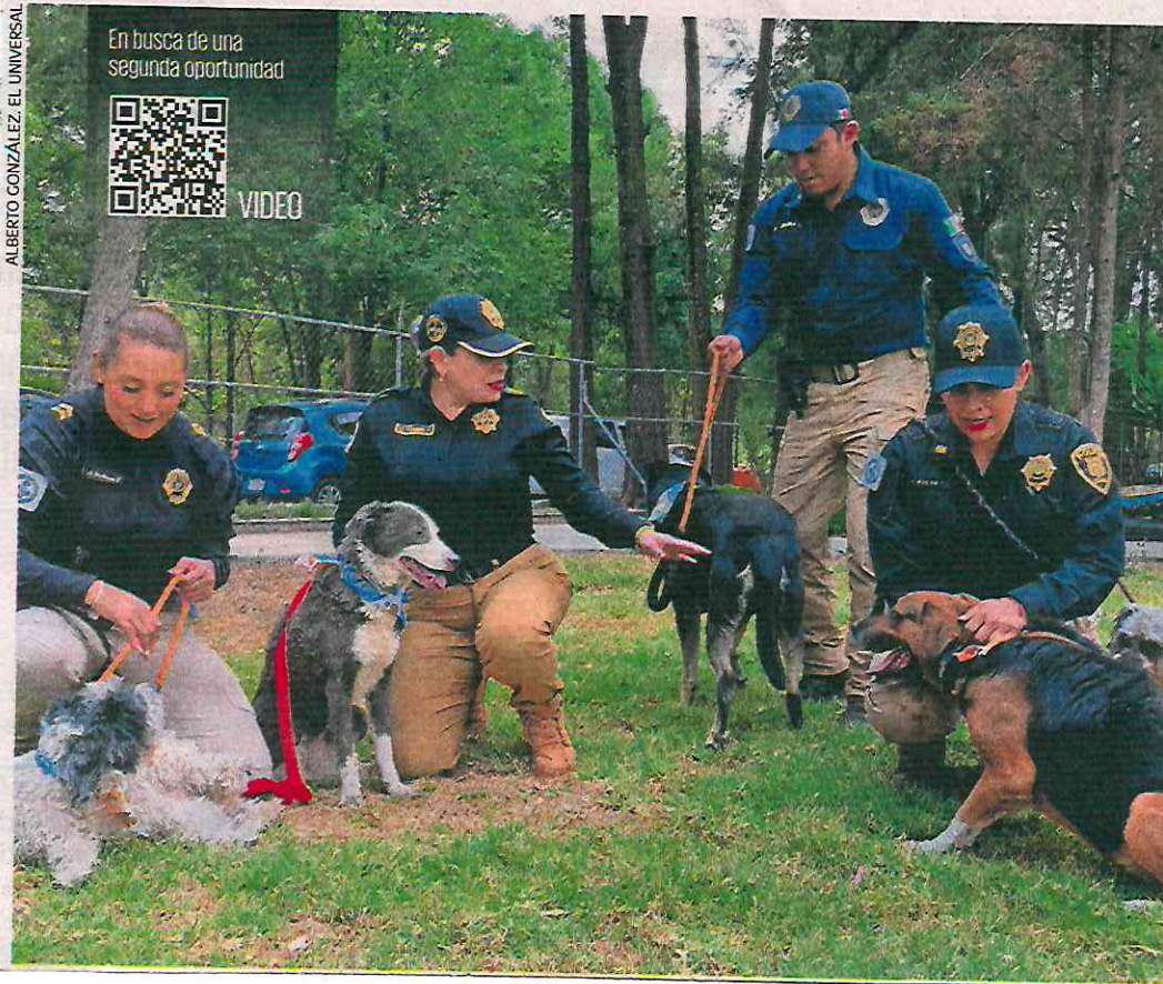
ALBERTO GONZÁLEZ, EL UNIVERSAL