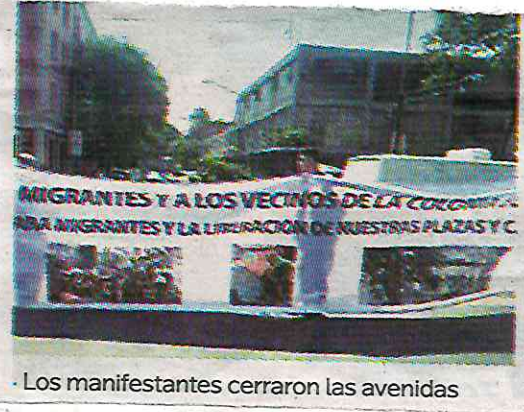
Los manifestantes cerraron las avenidas

a Estados Unidos, se han asentado grupalmente en lugares de esta colonia. "Antes venía mucho turismo, los museos que tenemos aquí, al Museo de Chocolate, el Foro Lucerna, y ahora ya no viene nadie, entonces los restaurantes ya no tienen lo mismo, bastante nos dio en la torre.. hasta los comercios ambulantes", dijo una manifestante.