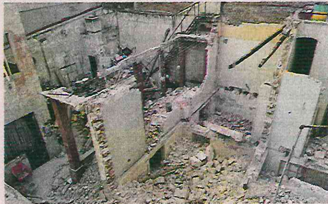
Un inmueble catalogado por su valor patrimonial es objeto de una demolición.

El derribo continuó en los primeros días de esta semana, por lo que personal de