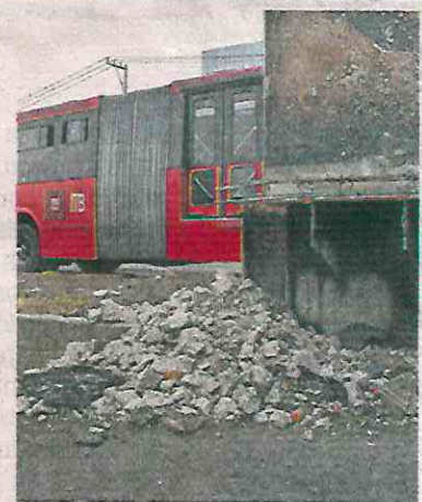
En febrero, un tráiler se impactó contra un muro de la estación.