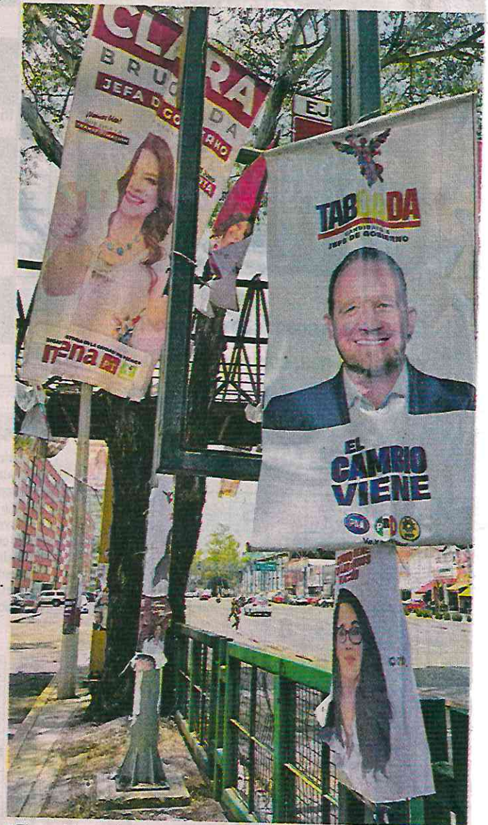
El presidente de la asociación señaló que la mayoría de la propaganda termina en la basura por la dificultad de recolección.

“Esto surge a raíz de la demanda de los ciudadanos por los efectos negativos que ha causado la propaganda de los candidatos en toda la Ciudad, por eso el llamado a ya no seguir apostando por este tipo de propaganda y para poder legislar desde el Congreso para su regularización”, dijo la candidata.