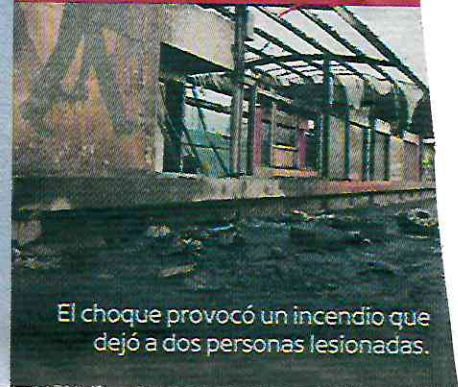
El choque provocó un incendio que dejó a dos personas lesionadas.