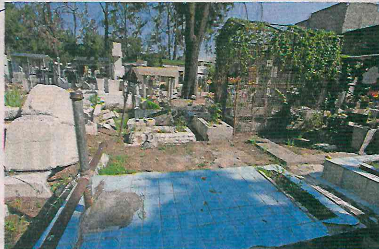
Los panteones civiles y concesionados notificarán a los propietarios de las fosas, si después de 90 días no hay respuesta, se exhuman los restos.

Se indica que la Dirección General Jurídica y de Estudios Legislativos tiene 120 días hábiles para realizar un diagnóstico de las fosas, gavetas, criptas y nichos en estado de abandono, tanto en cementerios civiles, como concesionados; para lo cual, requerirá dicha información a las personas administradoras designadas por los responsables.