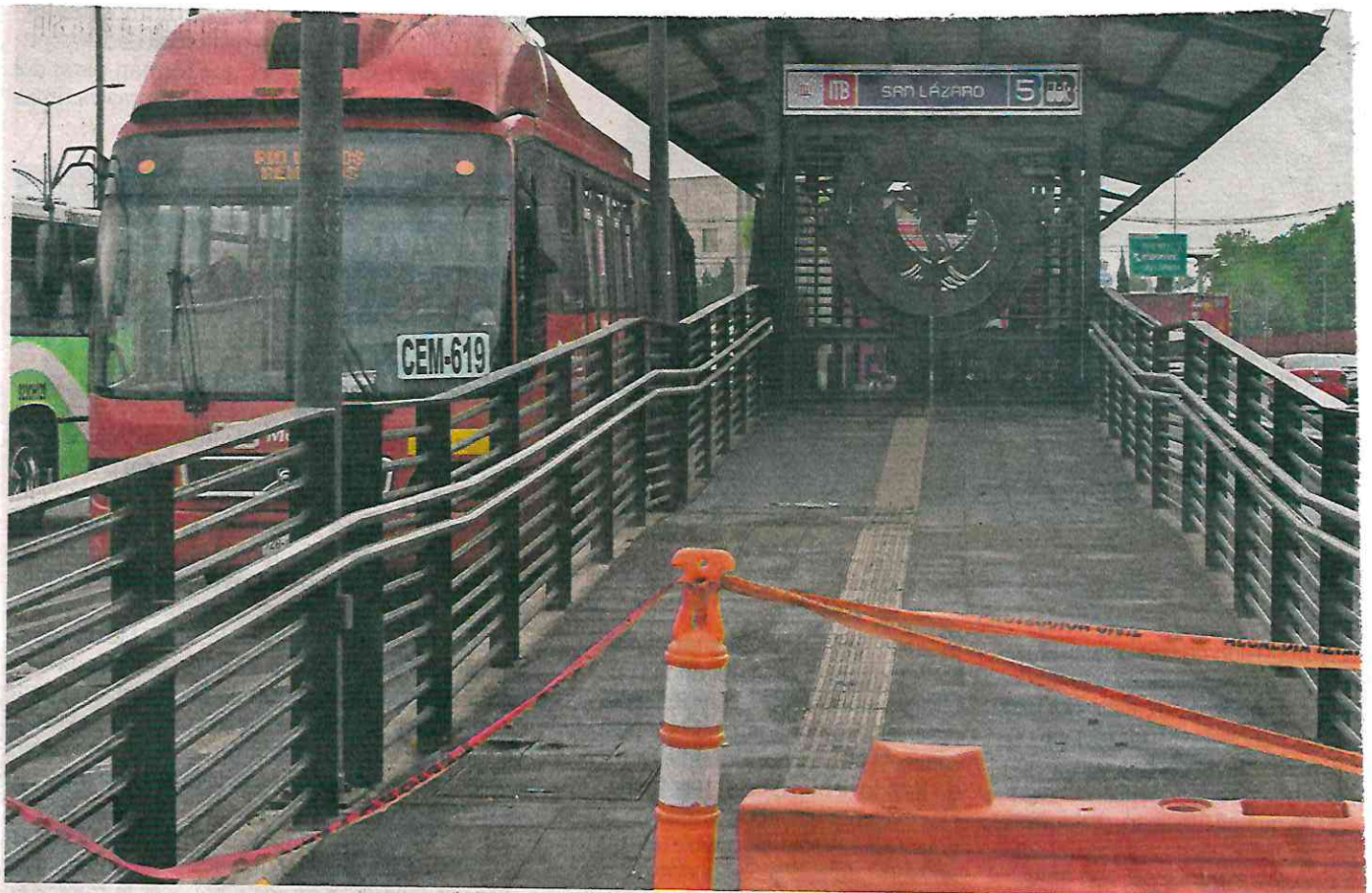
La plataforma de San Lázaro con dirección a la Preparatoria 1 sigue cerrada, por lo que los usuarios se aglutinan en la otra estructura.

Por ello, tiene dos estructuras que funcionan para desahogar el flujo de pasajeros, pero al estar cerrada una, se complica la movilidad de los mismos, y de acuerdo con la opinión de usuarios, también ha afectado la frecuencia del paso de las unidades. ●