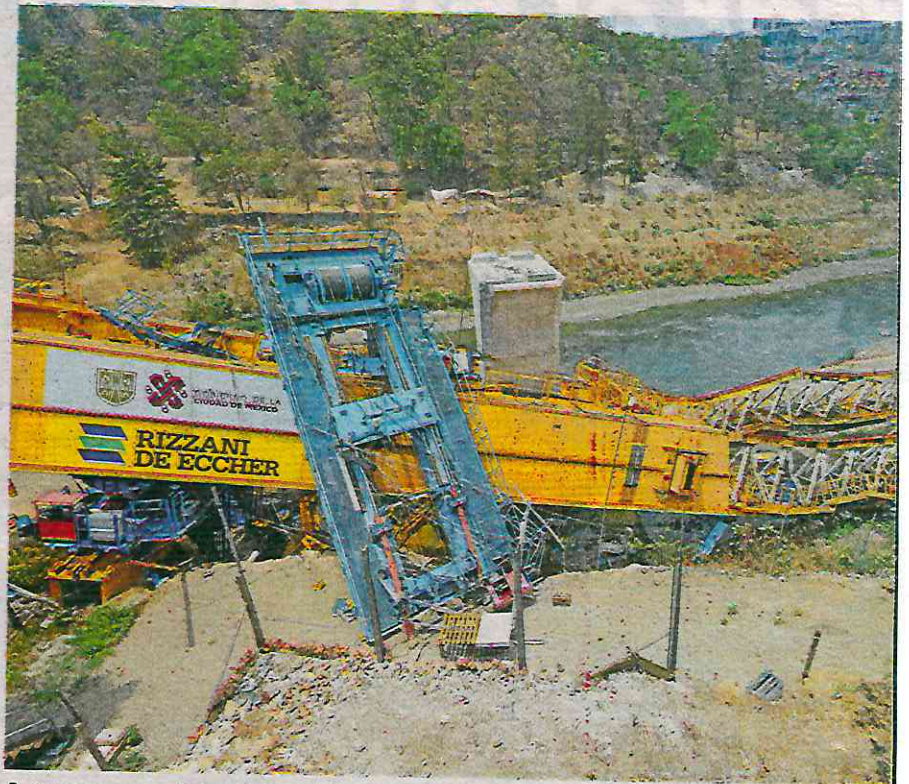
A una semana del accidente de la lanzadora de dovelas, sigue en el lugar, pues peritos de la FGJCDMX continúan con su trabajo