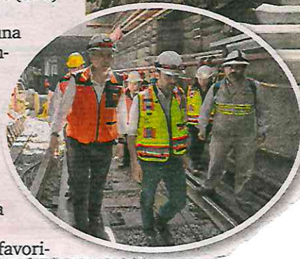
TIEMPO. Autoridades del Gobierno capitalino han supervisado los avances de la remodelación, que debe concluir en septiembre.