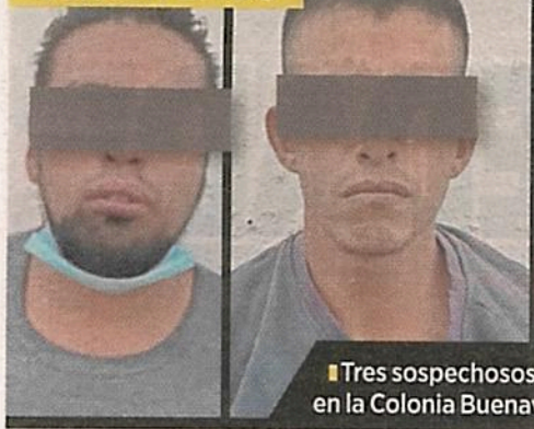
■ Tres sospechosos cayeron en la Colonia Buenavista.