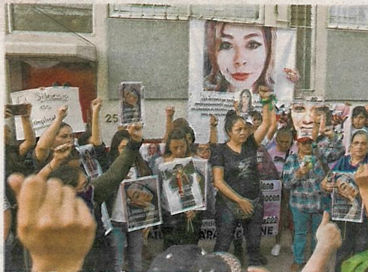
Buscan evitar la revictimización de mujeres violentadas

Subrayó que las iniciativas con perspectiva de género que ha presentado a lo largo de la legislatura, buscan tipificar el feminicidio en grado de tentativa, facilitar la denuncia y proteger a las mujeres con medias cautelares.