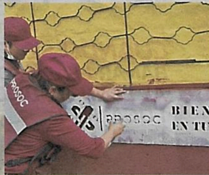
Brigadas de la Prosoc colocan los sellos en las bardas recién pintadas.

La solicitud para hacer esos trabajos fue de los vecinos de la uni-