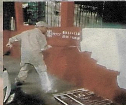
Horas después fueron borrados, por los trabajadores de la Cuauhtémoc.

dad; sin embargo, poco tiempo después de que los equipos terminaron su trabajo, llegaron los empleados de la alcaldía para borrar la pintura recién colocada.