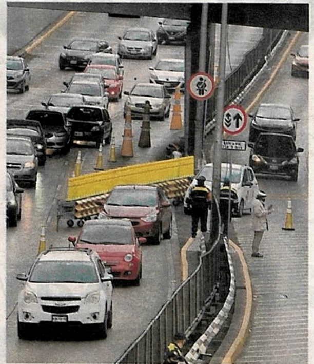
Por la mañana el recorrido de viaje se recortó de 30 a siete minutos

El carril reversible operará de lunes a viernes de 7:00 a 9:00 hacia Chapultepec y de 17:00 a 20:00 horas hacia La Raza