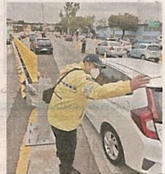
En el primer día, Tránsito orientó a los conductores.

De acuerdo con la Secretaría de Movilidad, a partir de la segunda semana de noviembre el congestionamiento vial empezó a aumentar, a la vez que ha incrementado la ocupación hospitalaria en los nosocomios que atienden el Covid-19.