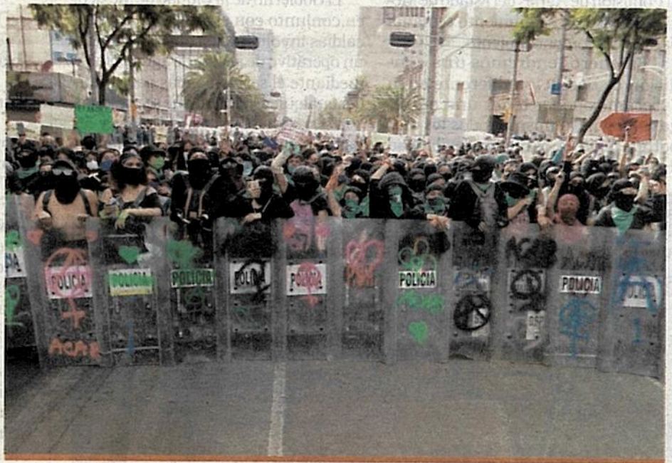
La exhaustiva investigación de la FGJ los llevó a una vendedora que fue citada por protestar en la vía pública.

Contrario a lo que muchos suponen, esta chica no sería una habitante de co-