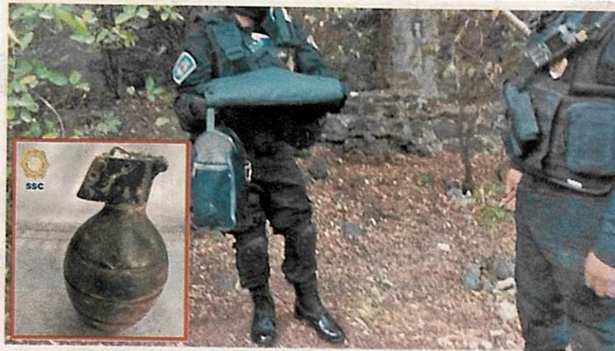
Uniformados de Fuerza de Tarea desactivan artefacto explosivo