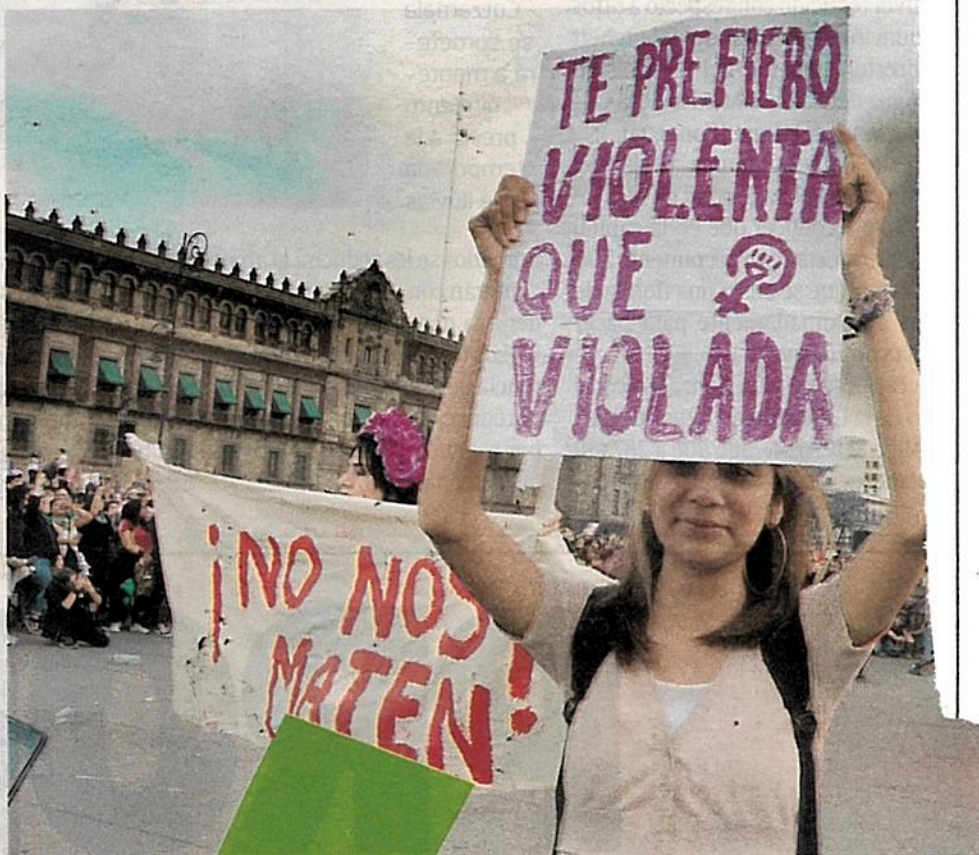
También sumará, bajo previa orden, información genética de familiares de víctimas de feminicidio /LAURA LOVERA