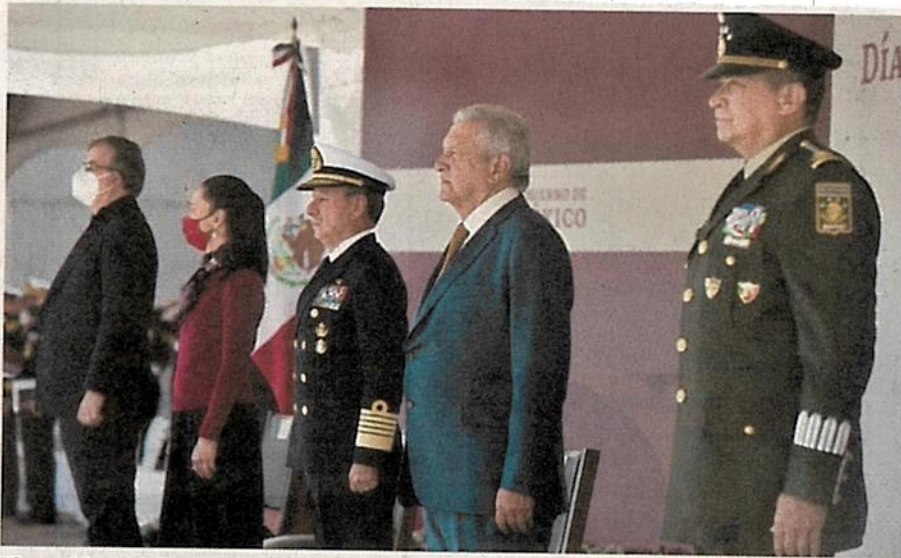
El presidente López Obrador encabezó la celebración por el Día de la Armada de México.