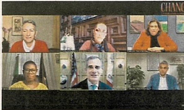
En un evento virtual participaron Claudia Sheinbaum y alcaldes de ciudades del mundo