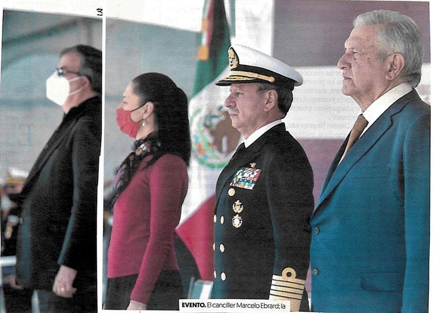
EVENTO. El canciller Marcelo Ebrard; la jefa de Gobierno, Claudia Sheinbaum; el titular de Marina, José Ojeda, y el presidente Andrés Manuel López Obrador, ayer.

Rafael Ojeda Durán, secretario de Marina, dijo que las Fuerzas Armadas tienen disciplina y espíritu de sacrificio, e insistió en lo dicho por el titular de la Defensa, Luis Crescencio Sandoval, de que no anhelan el poder.