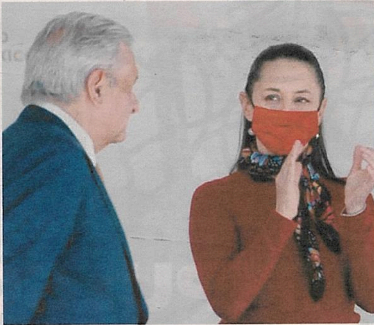
Sheinbaum y AMLO, en la celebración del Día de la Armada de México

Las alcaldesas de Barcelona (España); Freetwon (Sierra Leona); y la gobernadora de Tokio (Japón), expusieron sus experiencias como mujeres gobernantes