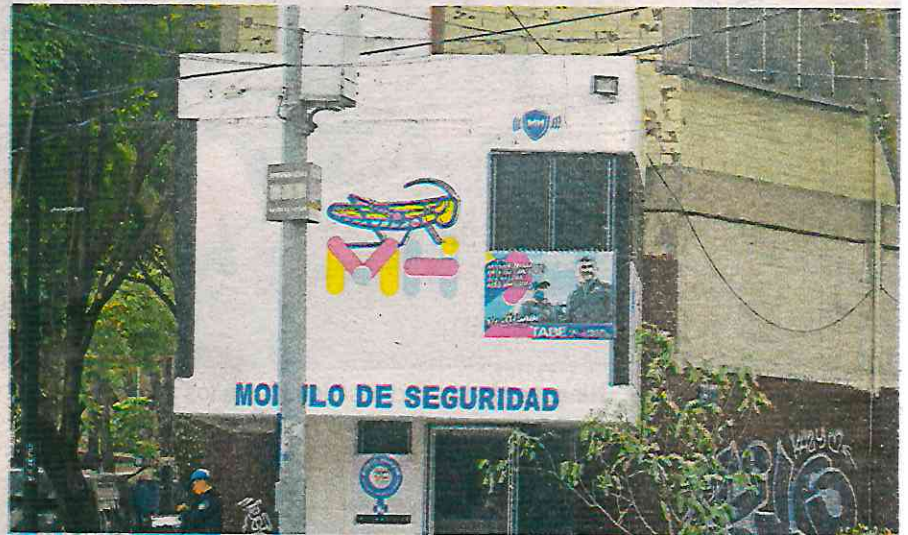
Los resultados en la CdMx dicen que la mitad de las alcaldías mejor calificadas son gobernadas por la oposición con un promedio de 44.9%

Entre las primeras hay un caso destacable: Miguel Hidalgo. Esta demarcación gobernada por Mauricio Tabe tomó las riendas del gobierno en 2021, cuando 8 de cada 10 miguelhidalguenses se sentían in-