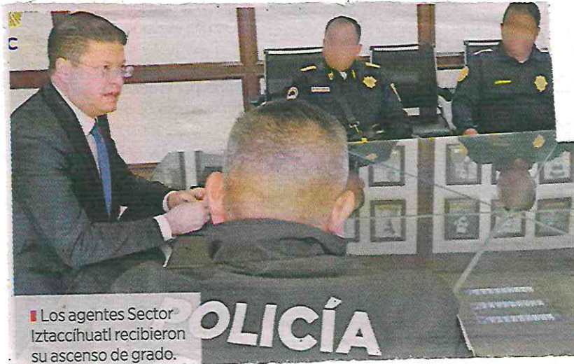
Los agentes Sector Iztaccíhuatl recibieron su ascenso de grado.

El Secretario les entregó su ascenso de grado por el trabajo diario y compromiso con la ciudadanía para la erradicación de cualquier tipo de violencia en contra de las mujeres.