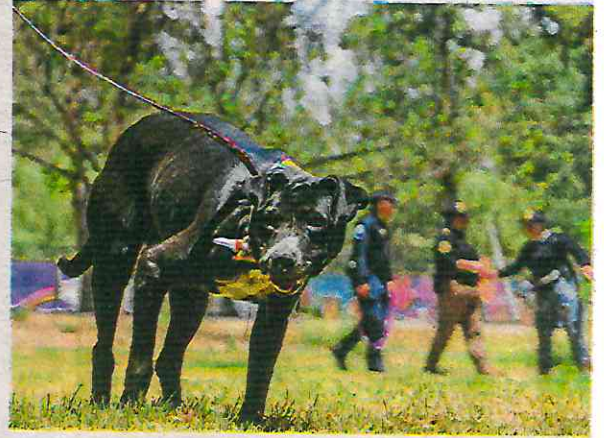
Madmuasele espera un hogar desde 2020 en la BVA

POR CIENTO de los perros rescatados por autoridades capitalinas son mestizos