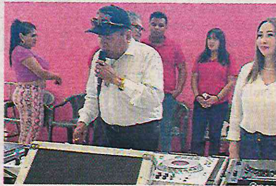
La Changa se encargó de poner el ambiente

Ni el intenso calor que se sentía fue impedimento para que las mujeres privadas de su