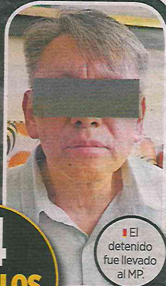
El detenido fue llevado al MP.