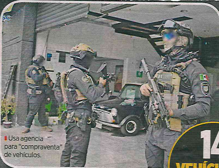
Usa agencia para "compraventa" de vehículos.