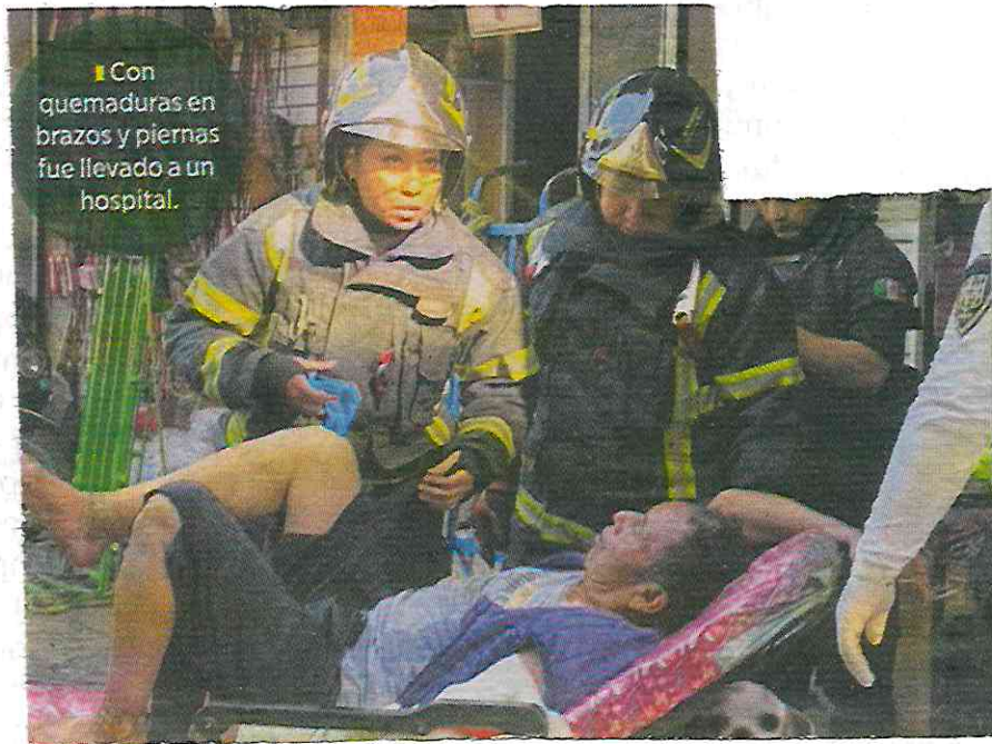
Con quemaduras en brazos y piernas fue llevado a un hospital.

Luego de este accidente, personal de Protección Civil de la Alcaldía y de la Comisión Federal de Electricidad retiraron los cables para evitar accidentes futuros.