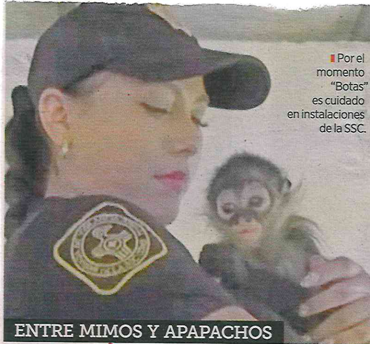
Por el momento "Botas" es cuidado en instalaciones de la SSC.