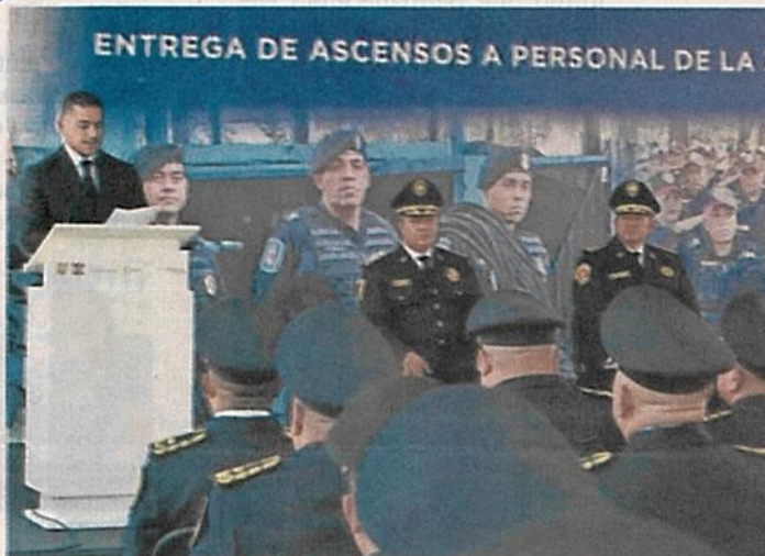
El secretario Omar García Harfuch reconoció a los elementos por mostrar el espíritu de la policía de la Ciudad de México.

"Las topamos de frente sobre Prolongación Reforma, ahí les marcamos el primer alto a distancia y hacen caso omiso. Empezamos una pequeña persecución mientras llegaban todos los apoyos. En la calle de Tamauli-