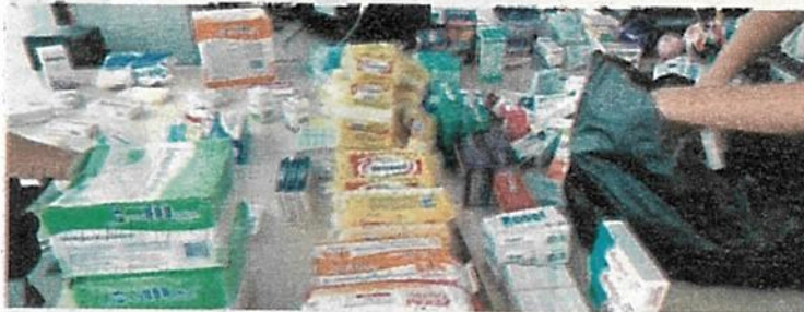
La venta corresponde a comerciantes que adquieren los fármacos a través del robo.

La vigilancia está destinada a los mercados y tianguis de la capital; alcaldías como Gustavo A. Madero está entre las principales afectadas