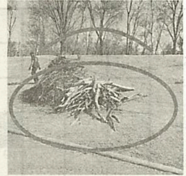
Los atraparon in fraganti

Por otro lado, en el deportivo Reynosa, vecinos le preguntaron a