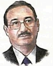
Alberto Pérez Dayán

POR CIERTO, AYER la Suprema Corte de Justicia de la Nación retomó la discusión de la constitucionalidad de la prisión preventiva, proyecto que empuja el ministro Luis María Aguilar . La discusión seguirá mañana con pocas posibilidades de que