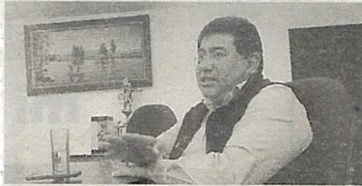
Acosta solamente gasta en trivialidades