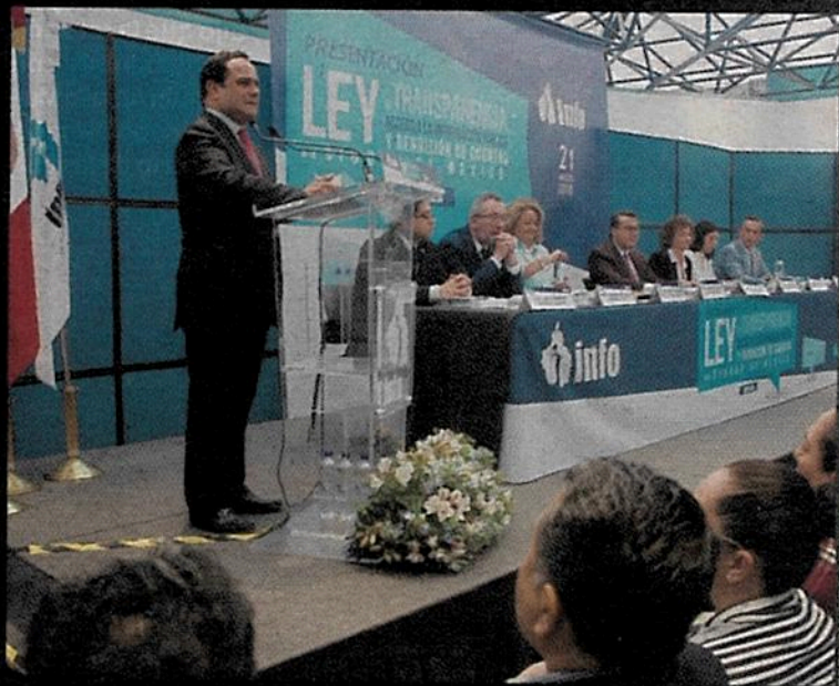
El InfoCDMX otorgó 167 contratos mediante adjudicación directa.

En los últimos dos años, los órganos autónomos de la Ciudad de México han contratado más del 60 por ciento de sus bienes y servicios por adjudicación directa, lo que supondría una violación a la Ley de Adquisiciones local