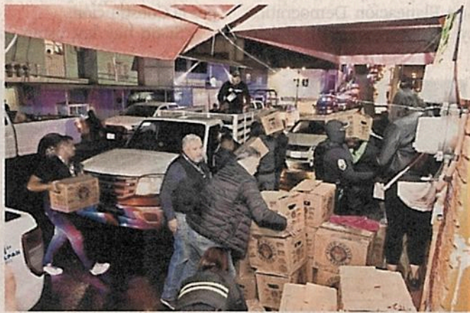
Un operativo fue desplegado el domingo: 11 establecimientos fueron suspendidos por vender bebidas alcohólicas.