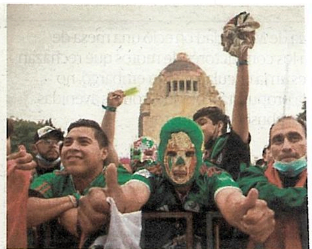
Cientos de mexicanos de todas las edades llegaron al Monumento a la Revolución para ver el primer partido de México en el Mundial.