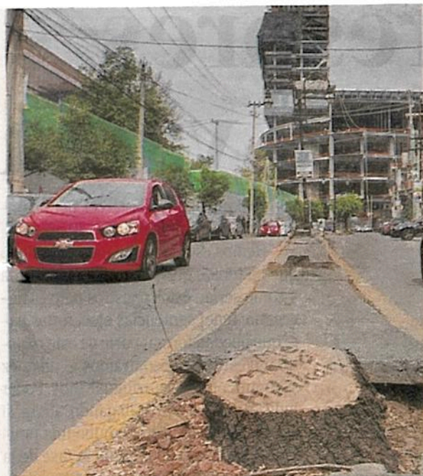
Actualmente la sanción máxima sólo es de hasta cinco años

La iniciativa de reformas al Código Penal fue turnada a la Comisión de Procuración de Justicia para su análisis.