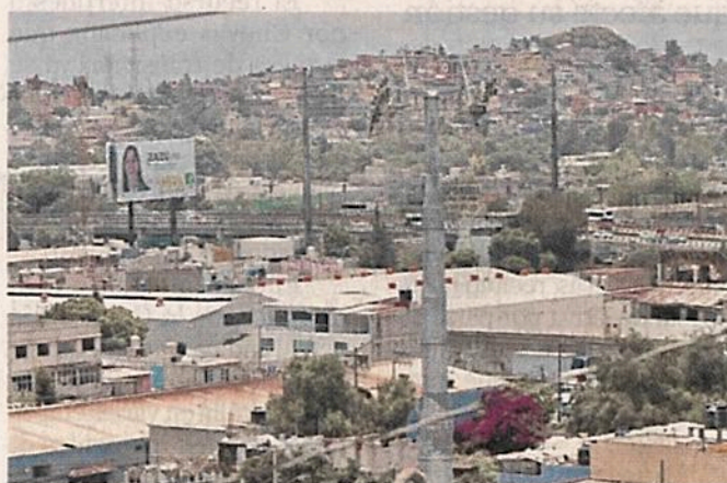
■ El tramo que cruzará el Cerro es parte del recorrido entre las estaciones Indios Verdes y Tanque de Agua.