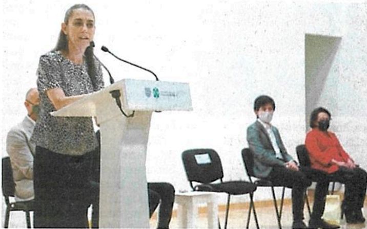
La jefa de Gobierno destacó que no se busca eliminar el presupuesto participativo de 2020 y el de este año.