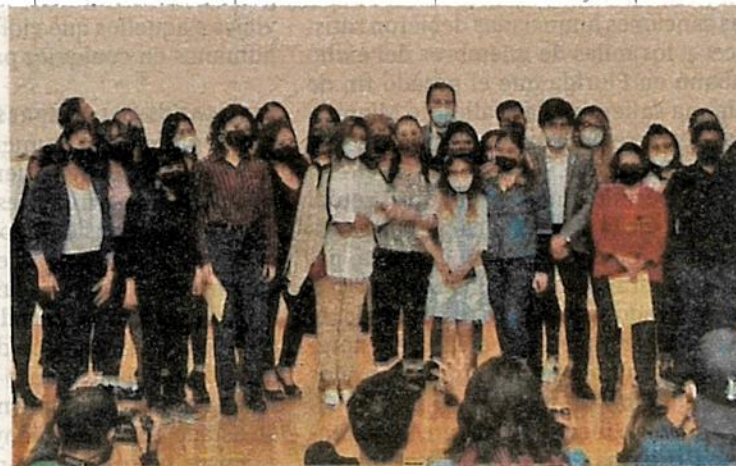
Claudia Sheinbaum, acudió a la nueva sede que iniciará nuevo ciclo en septiembre con más de cuatro mil estudiantes en cuatro licenciaturas.

calle de Justo Sierra, Sheinbaum Pardo externó que en su administración busca, a través de la educación, ofrecerle un mejor futuro a la población. Los jóvenes que se están formando en la licenciatura en Derecho y Criminología se vincularán a esa nueva perspectiva, y lo mismo en el caso del nuevo laboratorio de Observación Criminológica. (Redacción)