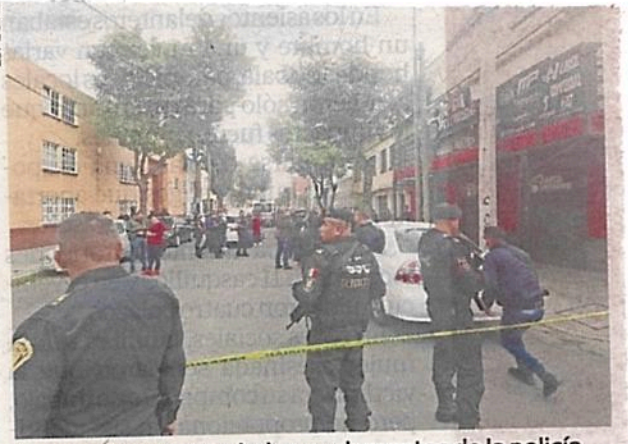
La zona fue resguardada por elementos de la policía.