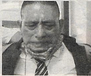
El militar detenido

CIUDAD DE MÉXICO. - Dos personas fueron detenidas tras una riña registrada en el Metro La Raza, durante la cual se reportaron disparos en uno de los pasillos.