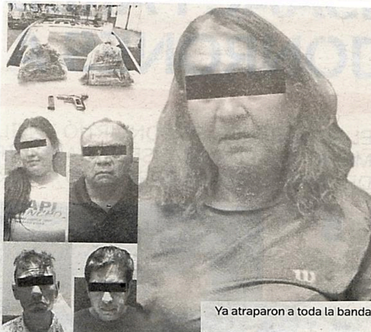
Ya atraparon a toda la banda

Por su parte, el segundo vehículo fue localizado en el cruce de la colonia Santa María la Ribera, donde los policías les encontraron 30 bolsas con marihuana. En esta acción detuvieron a un sujeto de 38 años de edad.