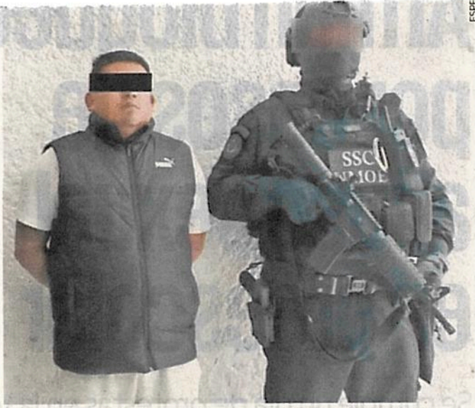
El sujeto fue detenido en Álvaro Obregón. Se le llevó al Reclusorio Sur y está acusado por homicidio en grado de tentativa.