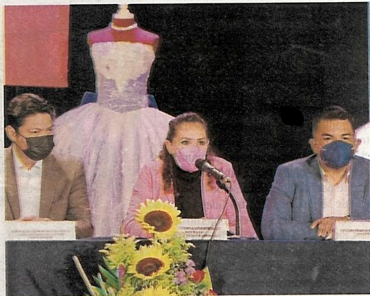
En conferencia de prensa, la Asociación de la Calle de las Novias y Ceremonias entregó 17 vestidos y un traje a hijas/hijo de reclusas

En el Teatro del Pueblo como escenario, jóvenes adolescentes recibieron su último juguete y el vestido de 15 años que utilizarán en la celebración del próximo 8 de julio en Santa Martha Acatitla con sus madres.