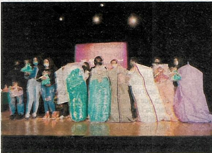
Todos los apoyos que ayuden a la reinserción son importantes, en especial a esta celebración también acudirán, si es el caso, padres que se encuentran reclusos en otros centros

"Estas iniciativas se tienen que impulsar, trabajar en un objetivo común donde podamos ayudar en el proceso de la reinserción social de quienes desafortunadamente hoy están privadas de su libertad, que podamos fortalecer los lazos familiares, mantener vivas las costumbres. Que todo nos ayude a reconstruir la familia, la comunidad y el tejido social y en esa perspectiva siempre van a contar con nosotros", aseguró el funcionario local.