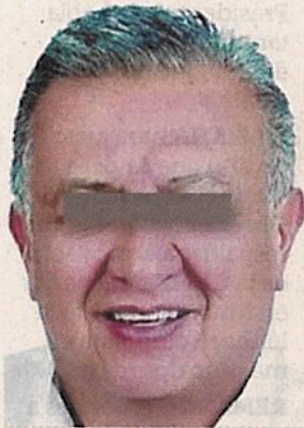
■ Saúl Huerta se entregó el 19 de agosto en la CDMX.

/// Hay una cuestión ahí de favorecimiento de parte de la Fiscalía hacia Saúl Huerta y nosotros vamos a denunciar este favorecimiento que está demostrado totalmente”.