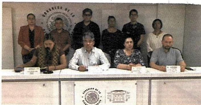
EL DIRIGENTE local de Morena (al centro), durante la conferencia de prensa, ayer.