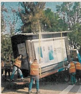
Personal de Coyoacán retiró cabinas de publicidad obsoletas.

La semana pasada, EL UNIVERSAL publicó la entrevista con el alcalde Giovanni Gutiérrez, en el marco de la conmemoración de 500 años del centro histórico, en la que dijo que efectuaría una renovación en las calles y los edificios, así como el retiro del ambulante.