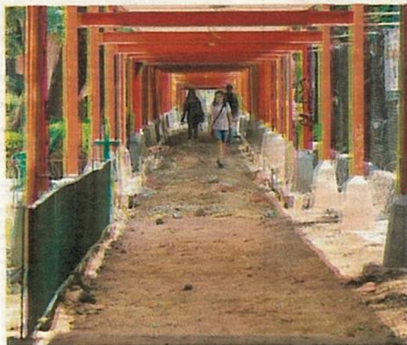
El tradicional color naranja desaparecerá