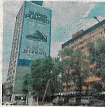
Primero lo primero... la lana

CIUDAD DE MÉXICO. — Se supone que habrá mesas de diálogo con artistas urbanos, vendedores y vecinos de la Cuauhtémoc, no obstante en la zona arqueológica de Tlatelolco, sus edificios sirven para hacer publicidad de varias marcas.