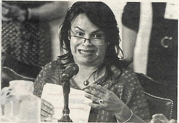
Distintos gastos en su gestión han sido cuestionados

• Hay incumplimiento de la ejecución del proyecto denominado iluminación de camellones