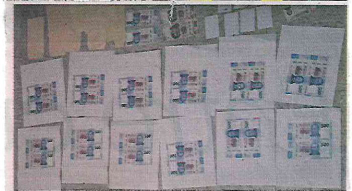
La banda se dedicaba a la elaboración de billetes falsos en papel moneda. En el domicilio fue rescatado un mono araña.