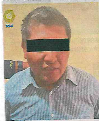
Feminicida dijo a agentes que presuntamente fue violado por su padre cuando era niño.