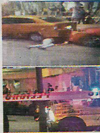
Noche de terror en Azcapo

El hecho ocurrió en la Unidad Habitacional El Rosario, en Azcapotzalco, donde quedaron los cuerpos sin vida de los 2 agentes asesinados. Muy cerca de ahí también se repor-