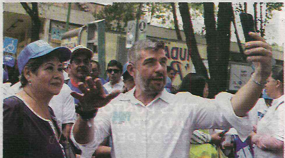
Tabe no cuenta con el título de Licenciado en Administración