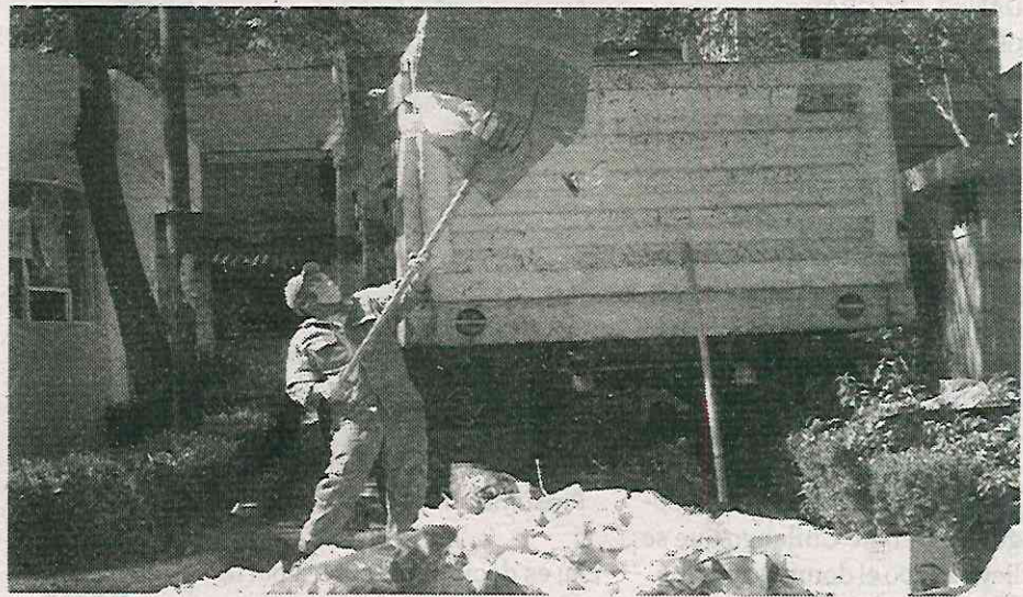
Las denuncias por basura acumulada en calles no fueron atendidas por la alcaldía

Sin embargo, durante los informes elaborados por la alcaldía,