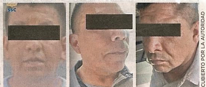
CUBIERTO POR LA AUTORIDAD