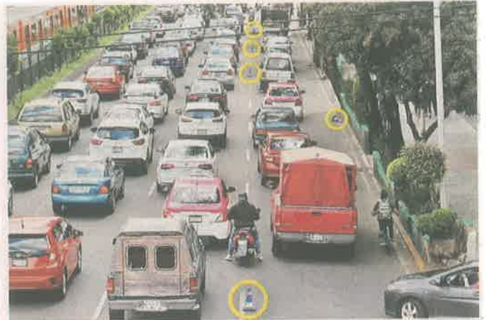
SIN RESPETO. Los autos tiraban los conos e invadían el carril confinado al transporte público en Calzada de Tlalpan.

El confinamiento acabó sobre avenida General Emiliano Zapata y Tlalpan, un kilómetro antes de lo prometido.