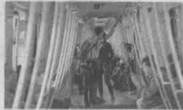
Deben dar preferencia al paso de los usuarios

fijas y dar preferencia al paso de los usuarios. Acceder por la puerta de servicio previo pago del peaje. Esperar el tren, replegados a la pared del andén de arribo.