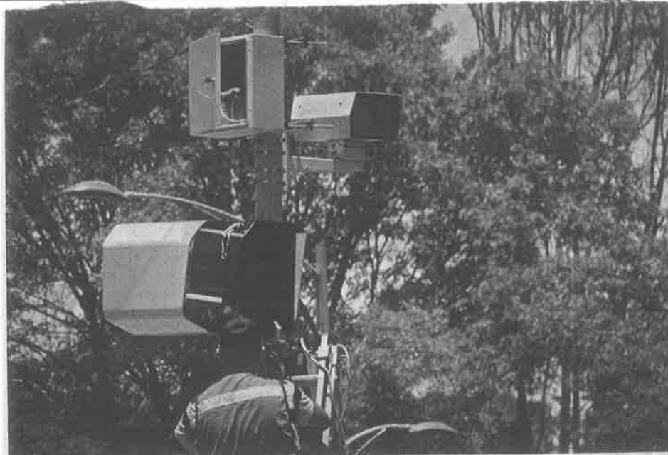
Ha sido un éxito, dice el titular de la Semovi a congresistas