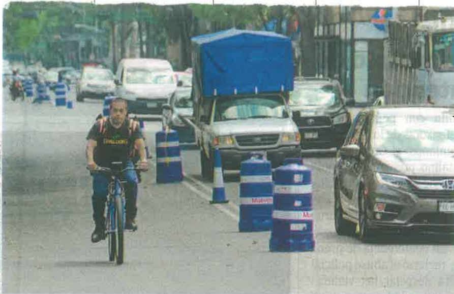
Ciclistas viajaron por Eje 2 aunque aún con algunos problemas