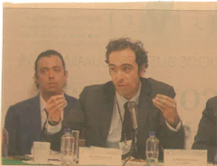
El secretario compareció ante la Comisión de Movilidad Sustentable del Congreso local.

Xochimilco, pero que ahora se está construyendo con una posible conexión al Tren Ligero en La Noria.