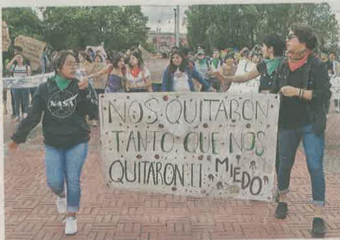
En su trayecto hasta Ciudad Universitaria, los jóvenes estuvieron acompañados por algunos padres.

La tarde de ayer, los jóvenes reclamaron avances en las indagatorias al Gobierno capitalino y la implementación de medidas preventivas por parte de las autoridades de la UNAM para combatir