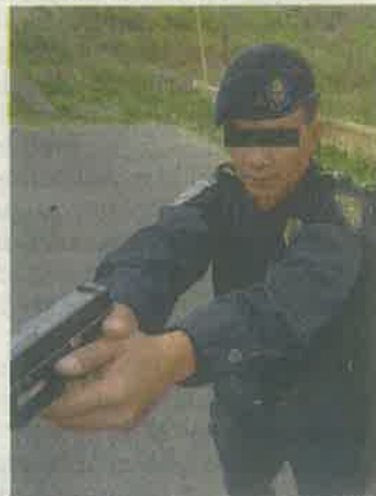
TANYA QUERRERO/EL UNIVERSAL