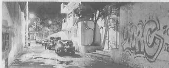
■ Una pensión en la Colonia La Fama fue asaltada.

La sucursal fue cerrada mientras se llevan a cabo las investigaciones y los agentes toman declaración de los empleados.