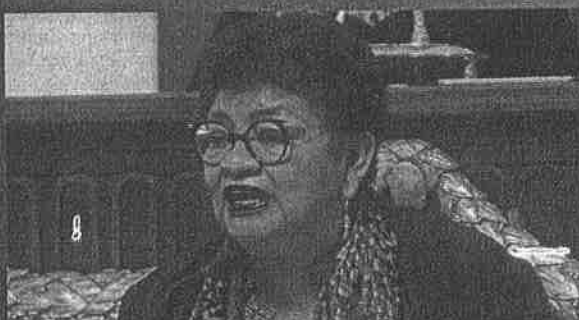
Ernestina Godoy es la actual procuradora de Justicia y Morena la impulsa para ser la próxima fiscal de la Ciudad de México.

La transición de Procuraduría General de Justicia a Fiscalía representa grandes desafíos para las autoridades locales por las situaciones que deben vencer para reducir los índices de impunidad en la Ciudad de México