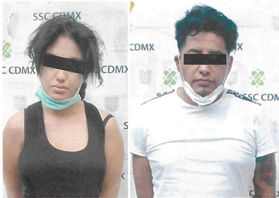
La mujer, que también se hacía llamar Yesenia, y Antonio "N" fueron ubicados cuando circulaban en un auto sin placas y con vidrios polarizados.

Penitenciario por el delito de robo agravado calificado en 2009.