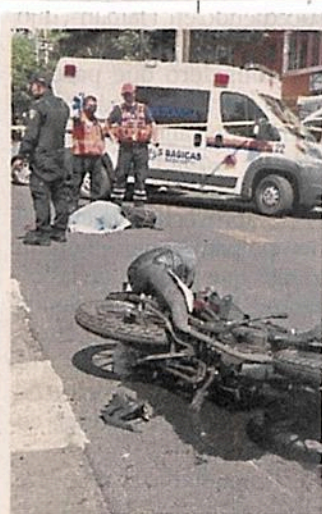
Los hechos ocurrieron el lunes en la Colonia Narvarte, Alcaldía Benito Juárez.

Tan sólo en el primer semestre de 2021 se registraron 366 víctimas mortales.