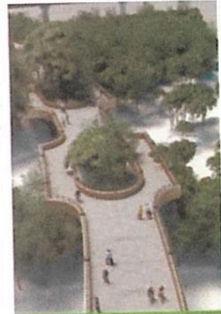
La Calzada Flotante unirá la Primera y la Segunda Secciones de Chapultepec.

Se consideran 115 trasplantes, 14 podas y 455 no se verán afectados y se tiene pensado plantar 474 árboles nuevos y se creará una superficie total de mil 306 metros cuadrados de áreas verdes. ●