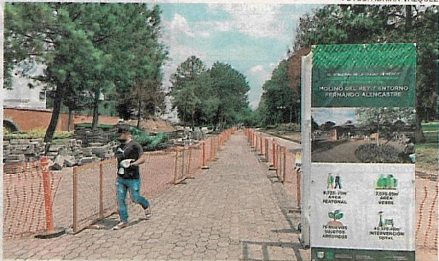
En Los Pinos ya comenzaron a realizarse las modificaciones al terreno

La autoridad capitalina reajust3 el proyecto que ayer presentaron de manera oficial las secretarías de Obras y Medio Ambiente. Permitirá la conexi3n peatonal de Molino del Rey- en la Primera Secci3n-, Avenida de los Compositores y la