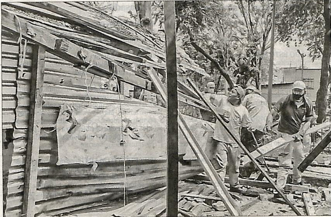
▲ El campamento irregular que se asentaba en la calle Clave de la colonia Vallejo fue retirado por personal de la alcaldía Gustavo A. Madero. Las