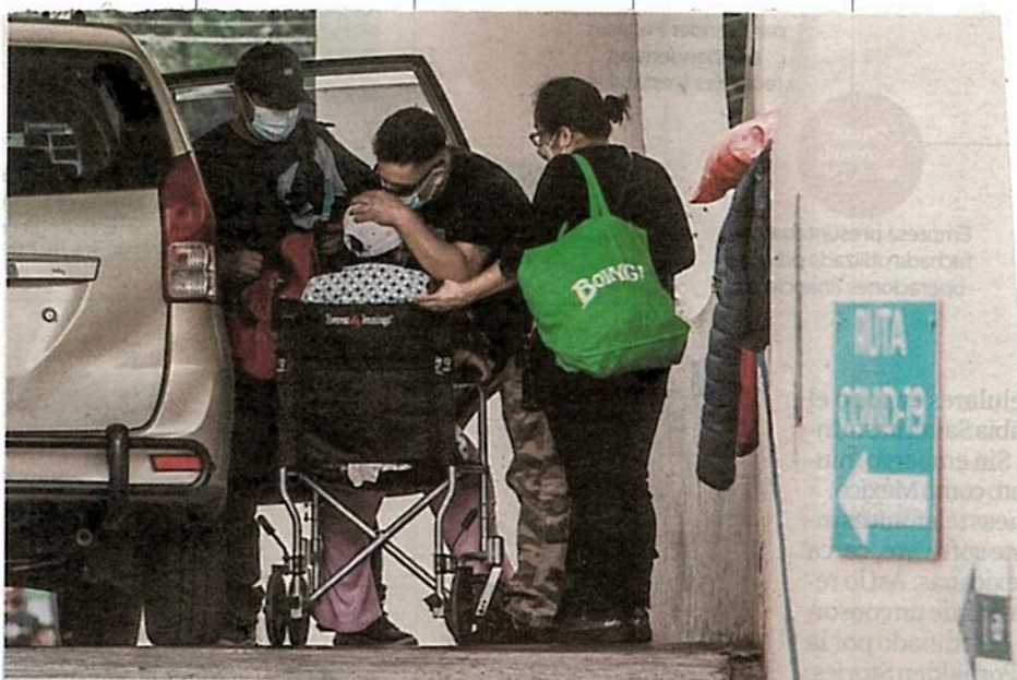
PANDEMIA. El hospital Venados, del IMSS, tiene una ocupación de 100%. Autoridades reportaron el miércoles 15 mil 198 nuevos contagios de Covid-19.

demia. Ayer, la Secretaría de Salud reportó 397 muertes más que ayer, por lo que el total acumulado de personas que han perdido la vida como consecuencia de esta enfermedad son 237 mil 207.