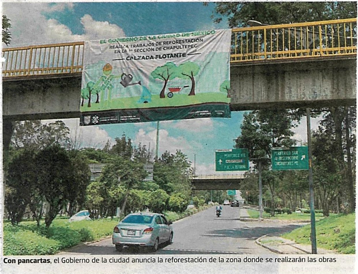
Con pancartas, el Gobierno de la ciudad anuncia la reforestación de la zona donde se realizarán las obras

464 ÁRBOLES SERÁN plantados para reponer los que serán derribados