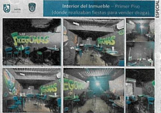
El bar ambulante Las Fregonas era un punto de venta de drogas; sobornaban a agentes de la SSC.

“Si analizamos desde tiempo atrás, La Unión Tepito se fundó igual, con el Cártel de Tláhuac