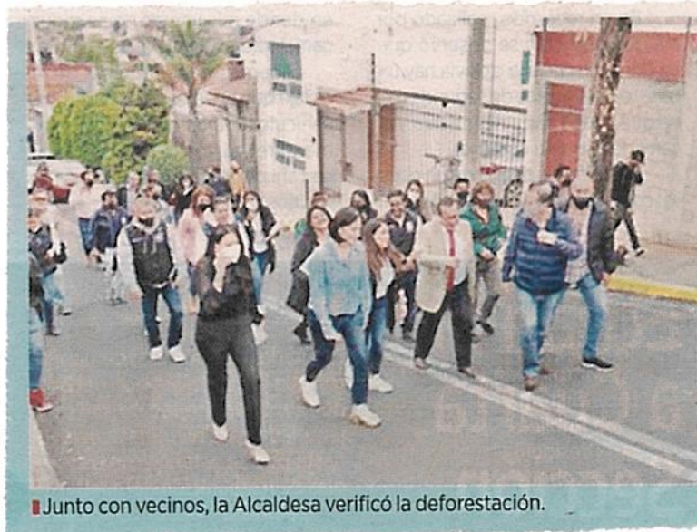
■ Junto con vecinos, la Alcaldesa verificó la deforestación.