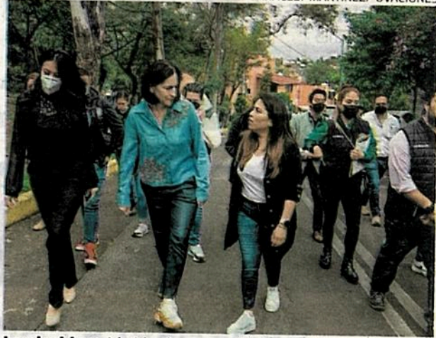
La alcaldesa Lía Limón presentó la queja