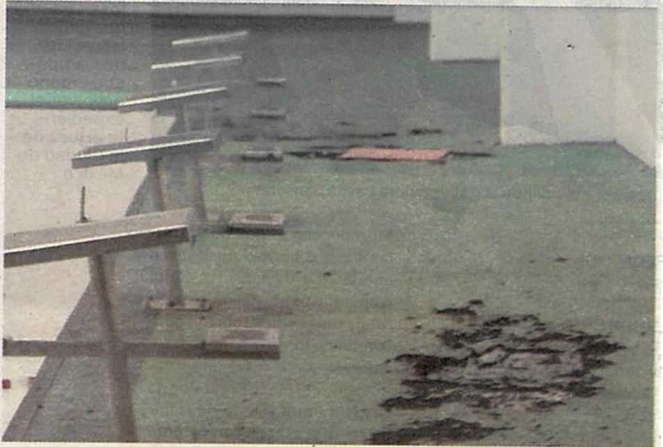
Graves filtraciones en la alberca

A través de un comunicado, la alcaldesa aliancista dijo que la "amplia inversión" realizada al deportivo Guelatao por el entonces alcalde Núñez López, de 42.4 millones de pesos, los cuales fueron utilizados principalmente para la parte esté-