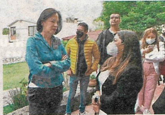
La alcaldesa de AO, Lía Limón García, dejó en claro que, en 2019, esta zona, fue decretada de valor ambiental

A su vez, la alcaldesa de Álvaro Obregón, Lía Limón García, dejó en claro que, en el 2019, esta zona de la barranca de Tarango, fue decretada de valor ambiental, pero hay grupos que se dedican a destruir y talar árboles sin que la autoridad local, en este caso