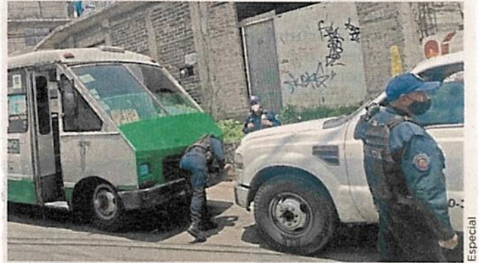
■ Pipas de gas abastecían a micros en calles de la Colonia Mesa de Hornos, en la Alcaldía Tlalpan.

Dijo que los operadores de las pipas no sólo surten a unidades de transporte público, si no también cilindros que les llevan vecinos.