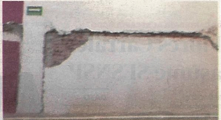
Los muros, con severas fracturas

de septiembre de 2021, Núñez entregó ante medios de comunicación y vecinos el Centro Social y Deportivo