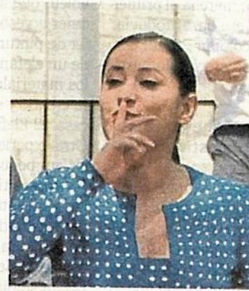
Cuevas aclaró que la inversión en el deportivo por el alcalde anterior, fue para estética del inmueble más no para atender las afectaciones estructurales.

Por determinación del GCD-MX, los trabajos de transición se vieron efectuados hasta el mes de septiembre de ese mismo año, im-