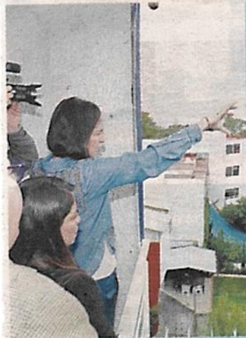
■ Dicen que desde lejos se aprecia la tala en Tarango.