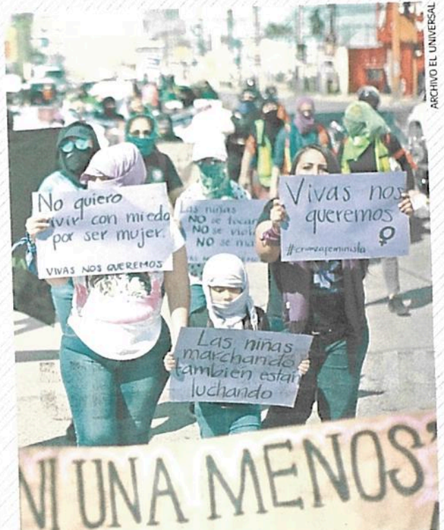
Sólo por el delito de violación, entre enero y mayo de 2021 se abrieron 8 mil 623 carpetas de investigación.

de feminicidio reportó el Edomex, según SESNSP.