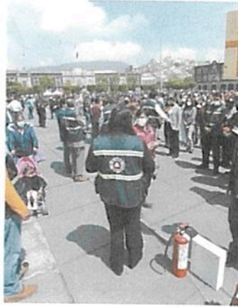
JORGE ALVARADO. EL UNIVERSAL

De los 9 mil 731 altavoces, funcionaron 9 mil 536. Las fallas registradas fueron principalmente por falta de energía eléctrica en los postes. ●