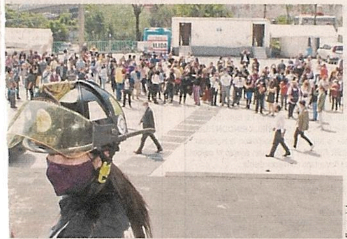
El Ayuntamiento de Naucalpan participó en el simulacro.