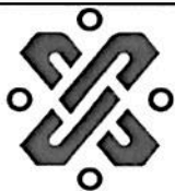
HAY NIVELES ESTABLES Saturación de hospitales Covid en la CDMX