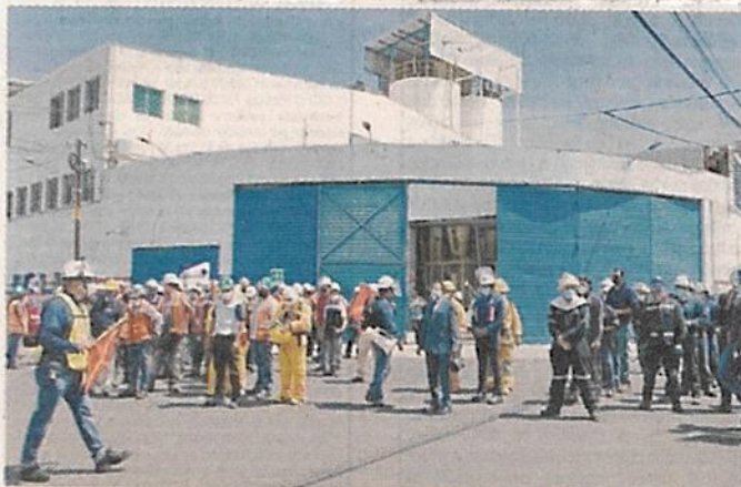
■ Autoridades de Naucalpan aseguraron que 5 bocinas en puntos estratégicos sí sonaron.

El Ayuntamiento de Naucalpan aseguró que funcionaron las cinco bocinas municipales que tiene en zonas estratégicas.