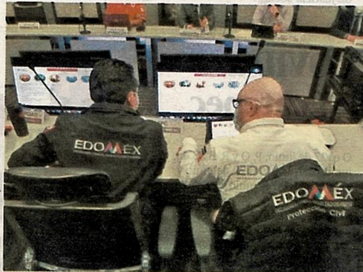
Vista del Centro de Control, Comando, Comunicación, Cómputo y Calidad (C5), de la Secretaría de Seguridad del Estado de México.

En punto de las 11:300 horas de este lunes, se activó la alerta sísmica en 9 mil 536 altavoces de 63 municipios y que son controlados por el Centro de Control, Comando, Comunicación, Cómputo y Calidad (C5), de la Secretaría de Seguridad del Edomex, y de inmediato se aplicaron los protocolos de emergencia y atención a la población mexiquense en centros habitacionales, de trabajo, en diversos inmuebles de instituciones públicas y privadas, cumpliendo con total coordinación con lo establecido en el primer simu-