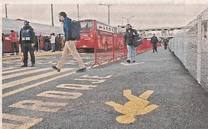
■ Pidieron también que se respete el acotamiento del Metrobús.