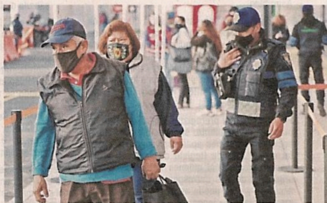
■ Los pasajeros explicaron que el gasto en traslados se reducirá.

media y ahora estoy haciendo dos horas y media. La verdad (la nueva ruta) nos ayuda bastante, en estos momentos, hasta que se tenga certeza qué va a pasar con la Línea 12, me parece un gran apoyo.