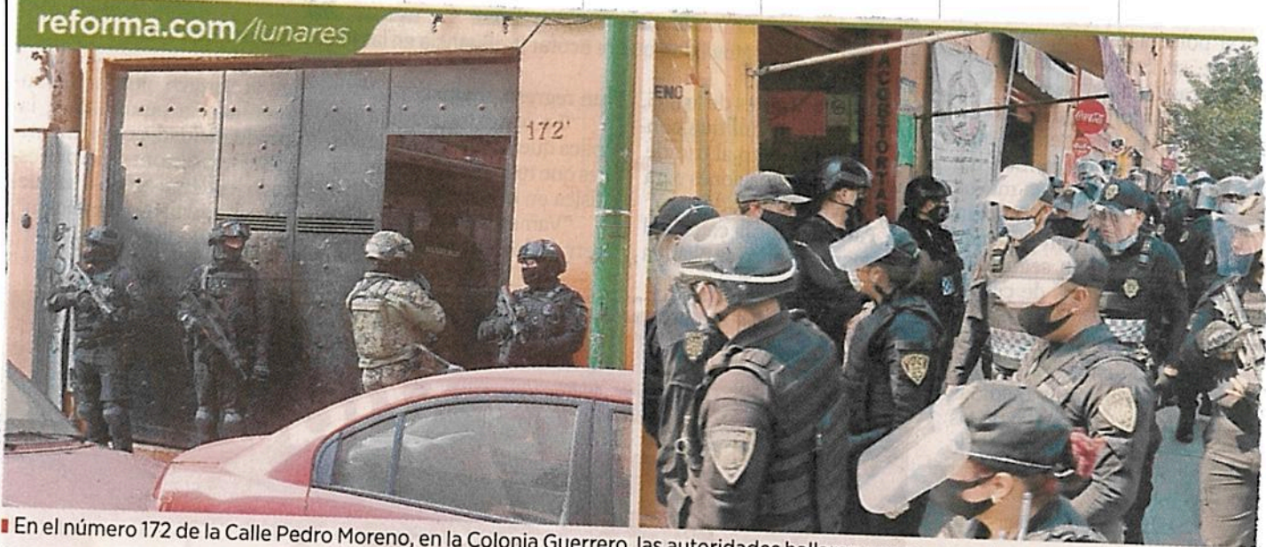
En el número 172 de la Calle Pedro Moreno, en la Colonia Guerrero, las autoridades hallaron una narcococina y precursores químicos.