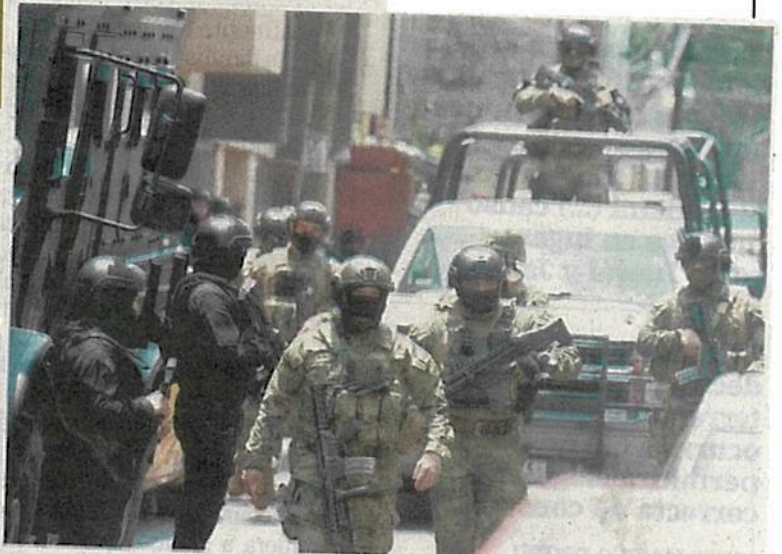
En medio de un fuerte operativo de seguridad, los tres presuntos integrantes de La Unión Tepito fueron trasladados a la SEIDO.