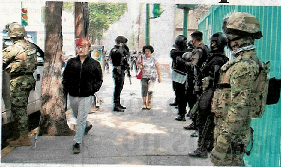
Elementos de seguridad custodian el inmueble donde se realizó el operativo en la colonia Guerrero