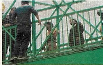
Muerte segura tendría el sujeto de haber saltado de gran altura

Uniformados resguardaron el perímetro y en coordinación con el área de Transportación Metro se realizó el corte de la corriente eléctrica. Tras varios minutos de diálogo entre oficiales, paramédicos y el presunto suicida, lograron convencerlo a desistir de su decisión, hasta que, en una acción coordinada, realizaron las maniobras necesarias para salvaguardar su integridad física.