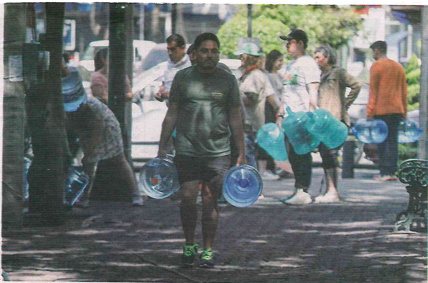
Recolección de agua en el Parque San Lorenzo

Culpar a otros. El jueves 18 de abril el Sacmex anunció que presentó ante la Fiscalía de Justicia de la CdMx una denuncia “por hechos con apariencia de delito de sabotaje” por contaminación en el pozo Alfonso XIII. Con esa acusación, la autoridad de la CdMx reconoció que el agua ha estado contaminada. Ahora, sin presentar evidencias y sin explicar qué ocurrió, busca un culpable.