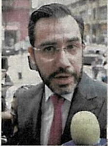
Jesús Orta Martínez

Un gran dolor de cabeza le generó al Gobierno capitalino el presunto abuso sexual que cometieron policías en contra de una joven en calles de la alcaldía Azcapotzalco; sin embargo, las marchas, desmanes, pintas y la presión social se las hubieran ahorrado si desde un principio el jefe de la policía capitalina, Jesús Orta , hubiera proporcionado los videos que captaron las cámaras con que están equipadas las nuevas patrullas, que costaron dos millones de pesos cada una, y que, como anunciaron, están equipadas con GPS y videocámaras al interior. El día en que ocurrieron los hechos, los policías llegaron al lugar en dos de esas nuevas unidades. Así que aún está a tiempo la administración capitalina de aclarar todo simplemente presentando los videos; a menos de que no existan o que las equipadísimas patrullas no hayan tenido las cámaras con las que deben contar.