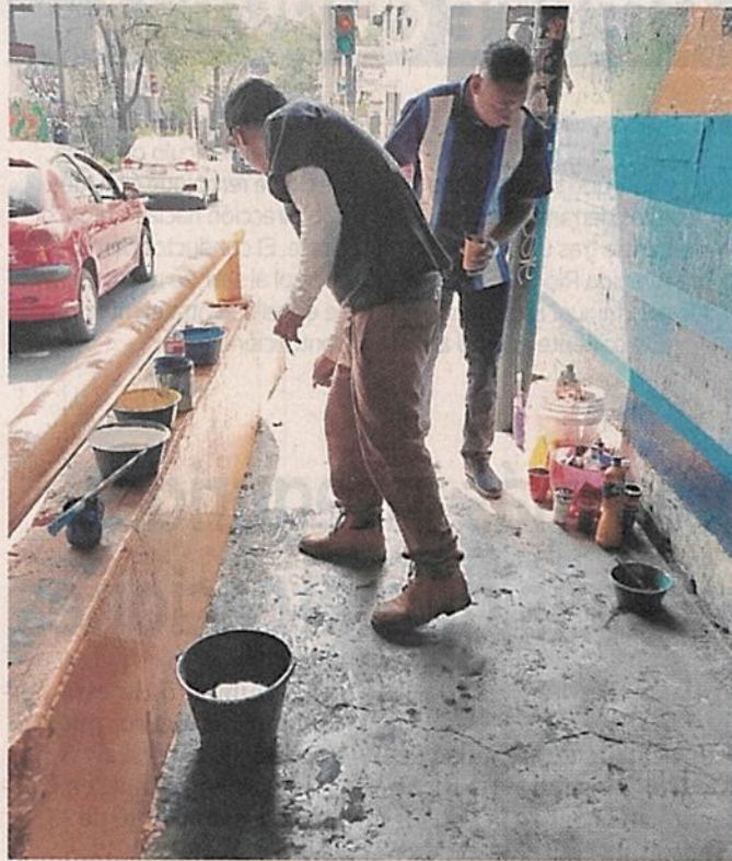
La restauración del mural comenzó la semana pasada.

Indicó que, luego de su exitosa participación en Costa Rica, donde plasmaron un mural contra la violencia de género en un parque público en la localidad de Paraíso, recibieron una nueva invitación para ejecutar una obra alusiva a la celebración de