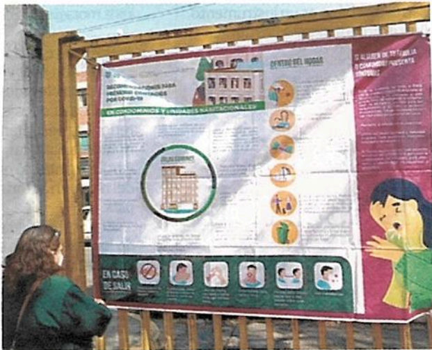
EN LAS UNIDADES habitacionales se presenta un sinnúmero de quejas, entre las que están la invasión y modificación de espacios.

6 Mil unidades de interés social hay en la Ciudad de México